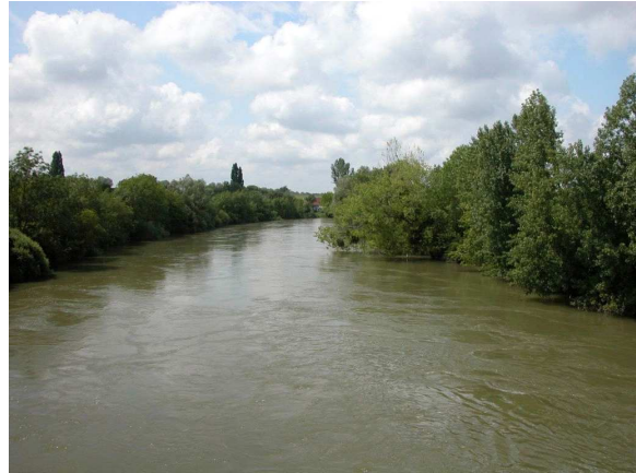
Vue aval du point de prélèvement invertébrés