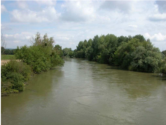
Vue amont du point de prélèvement invertébrés

Code de la station : 03012100 Cours d'eau : SEINE Commune : COURCEROY Code INSEE de la commune 10106 Date de mise à jour : 22/02/2016