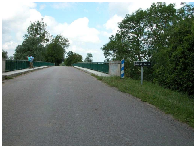
Vue générale d'accès à la station