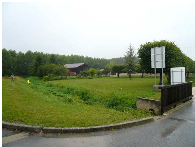
Vue générale d'accès à la station