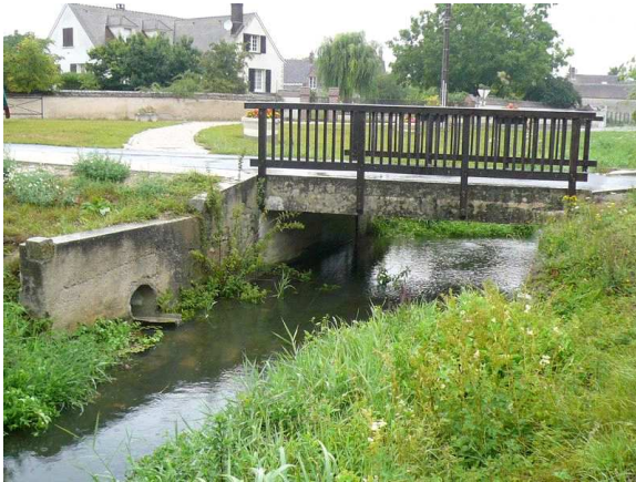
Vue amont du point de prélèvement invertébrés

Code de la station : 03013660 Cours d'eau : AUXENCE Commune : VIMPELLES Code INSEE de la commune 77524 Date de mise à jour : 16/02/2016