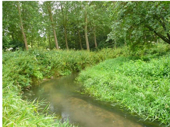
Vue aval du point de prélèvement invertébrés