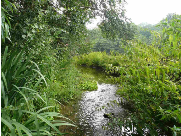
Vue amont du point de prélèvement invertébrés

Code de la station : 03051500 Cours d'eau : ALMONT Commune : MOISENAY Code INSEE de la commune 77295 Date de mise à jour : 19/06/2015