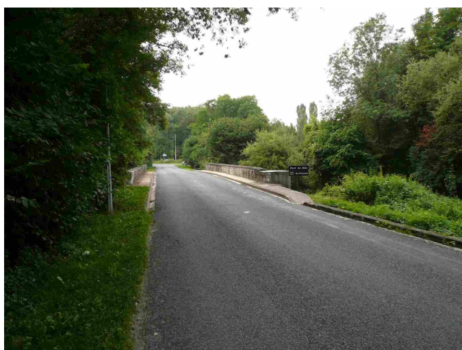
Vue générale d'accès à la station