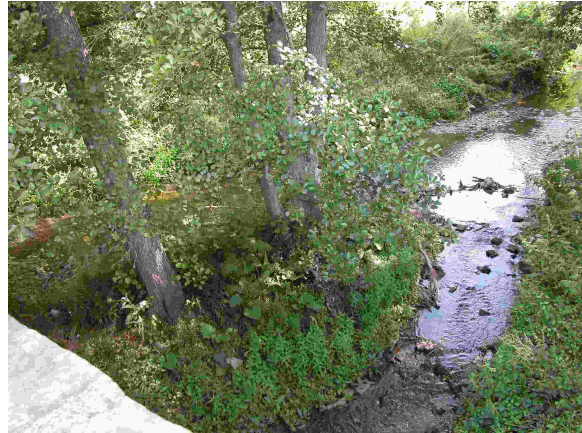
Vue aval du point de prélèvement invertébrés