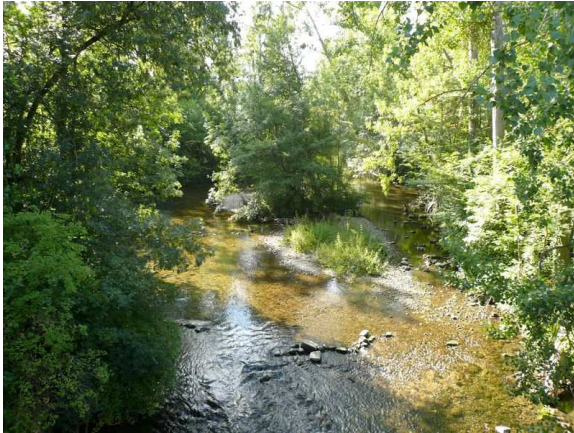
Vue amont du point de prélèvement