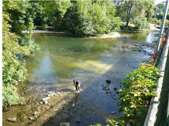
Vue aval du point de prélèvement