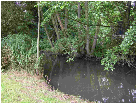
Vue amont du point de prélèvement invertébrés

Code de la station : 03071080 Cours d'eau : ORGE Commune : SERMAISE Code INSEE de la commune 91593 Date de mise à jour : 19/06/2015