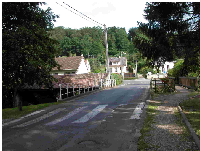
Vue générale d'accès à la station