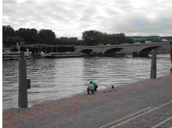
Vue aval du point de prélèvement