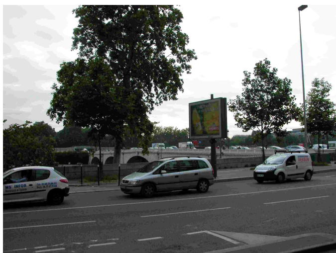
Vue générale du point de prélèvement