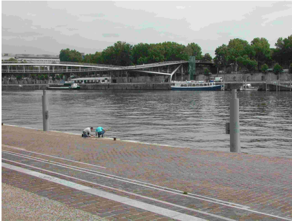
Vue amont du point de prélèvement