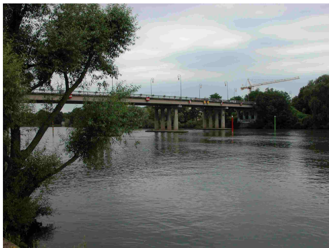
Vue générale du point de prélèvement