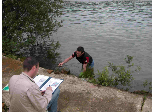
Vue aval du point de prélèvement