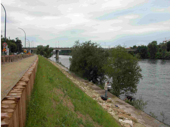
Vue amont du point de prélèvement