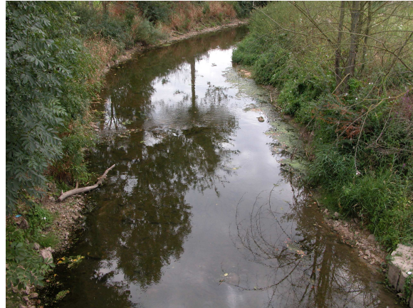
Vue aval du point de prélèvement invertébrés