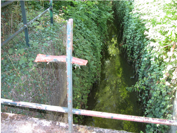
Vue amont du point de prélèvement invertébrés

Code de la station : 03112295 Cours d'eau : MORBRAS Commune : SUCY-EN-BRIE Code INSEE de la commune 94071 Date de mise à jour : 04/03/2016