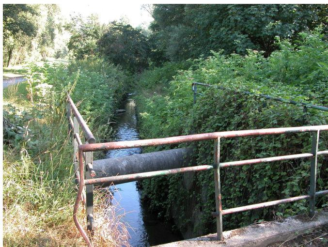
Vue générale d'accès à la station