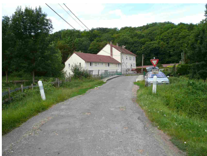
Vue générale d'accès à la station