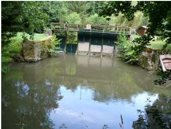
Vue amont du point de prélèvement invertébrés

Code de la station : 03114000 Cours d'eau : PETIT MORIN Commune : JOUARRE (lieu-dit Vanry) Code INSEE de la commune 77238 Date de mise à jour : 05/06/2015