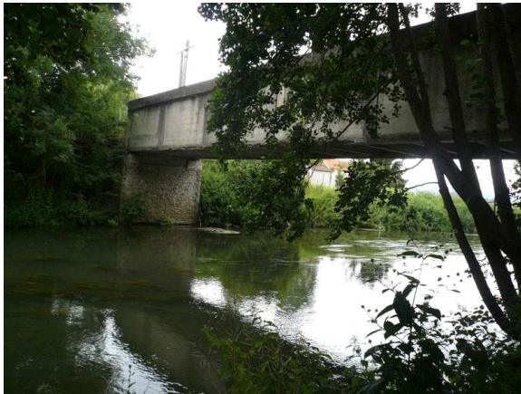
Vue amont du point de prélèvement invertébrés

Code de la station : 03118300 Cours d'eau : GRAND MORIN Commune : TIGEAUX Code INSEE de la commune 77466 Date de mise à jour : 18/03/2016