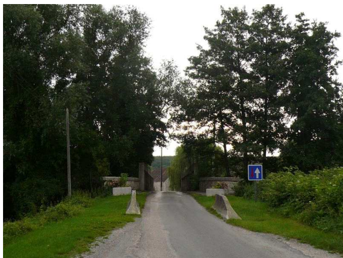
Vue générale d'accès à la station