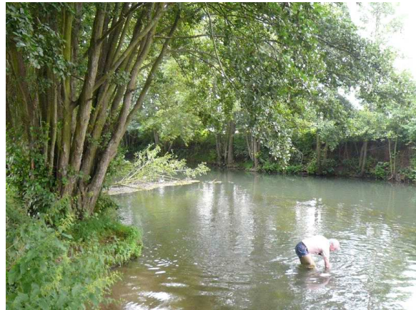
Vue aval du point de prélèvement invertébrés