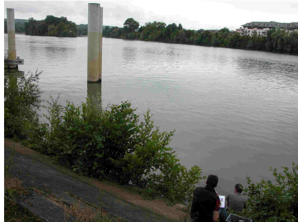
Vue aval du point de prélèvement