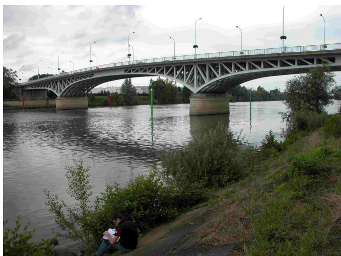
Vue générale du point de prélèvement