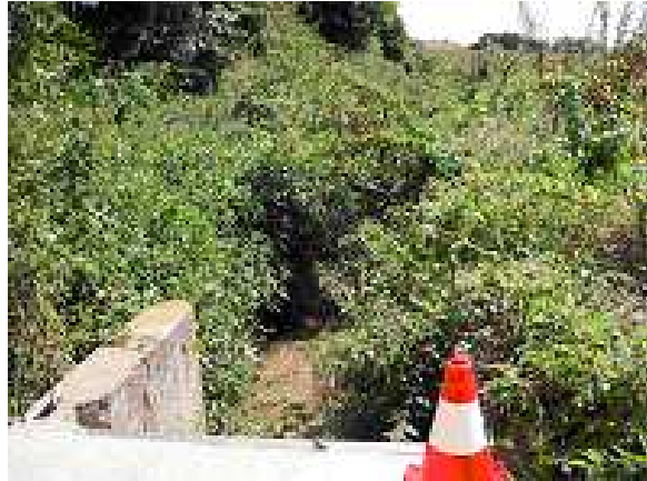
Vue aval du point de prélèvement