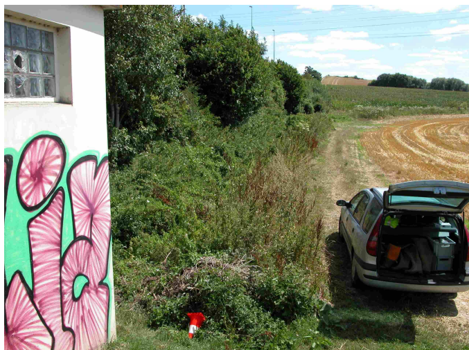
Vue générale du point de prélèvement