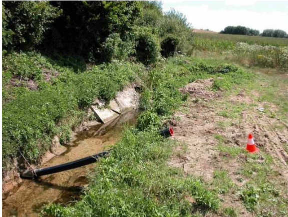
Vue amont du point de prélèvement