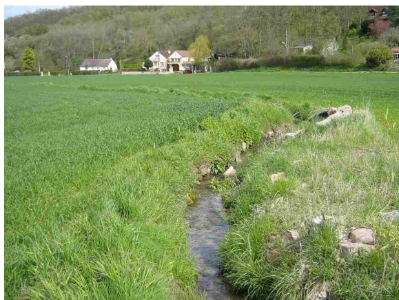
Vue amont du point de prélèvement