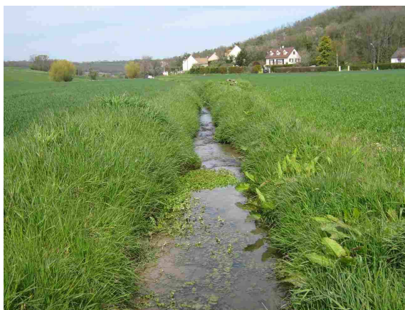
Vue aval du point de prélèvement