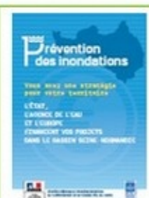
Plaquette financement Inondation