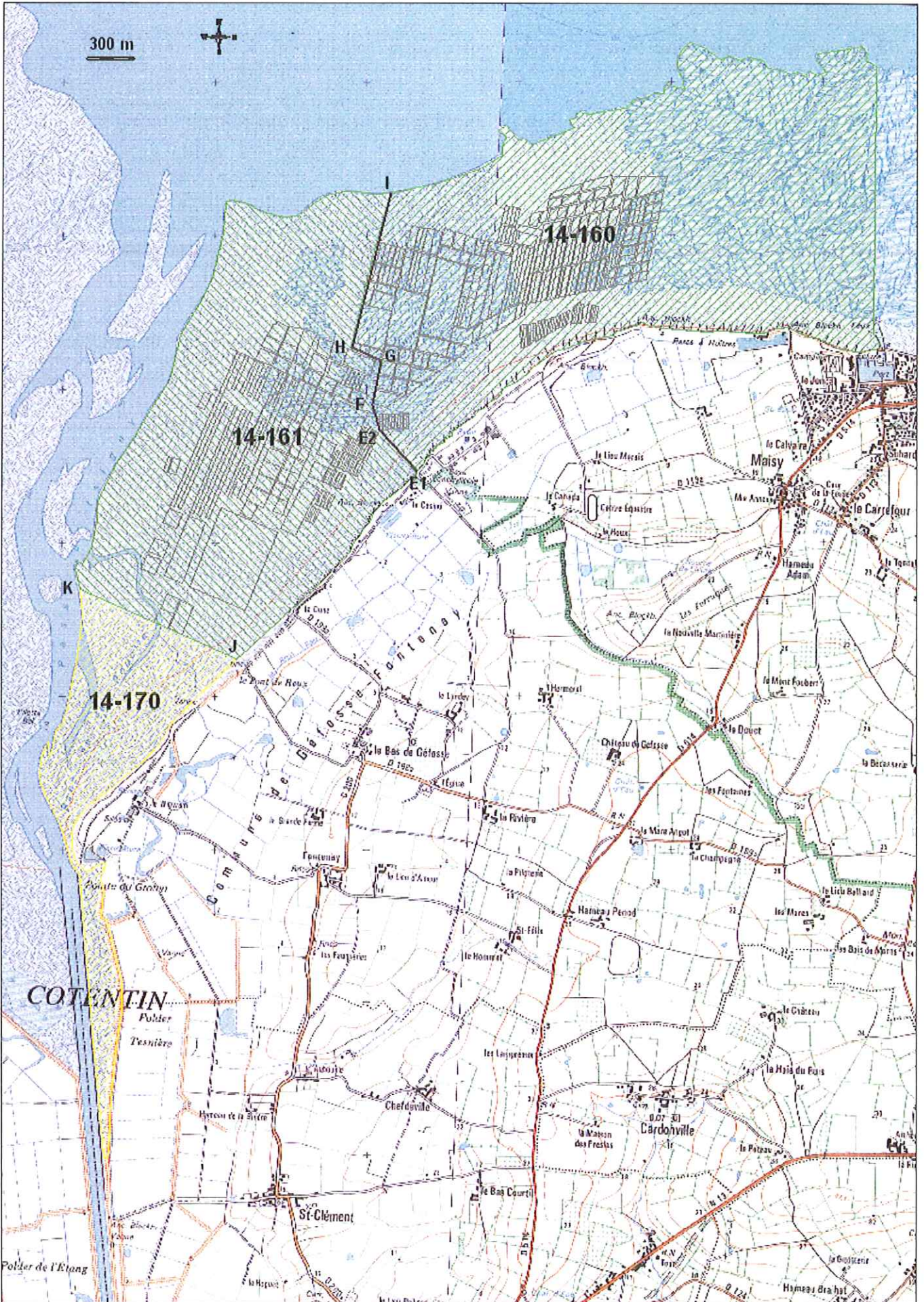
Carte 7 modifiée : Baie des Veys : secteur conchylicole (zones 14-160 et 14-161) et zone 14-170 de Géfosse-Fontenay sud