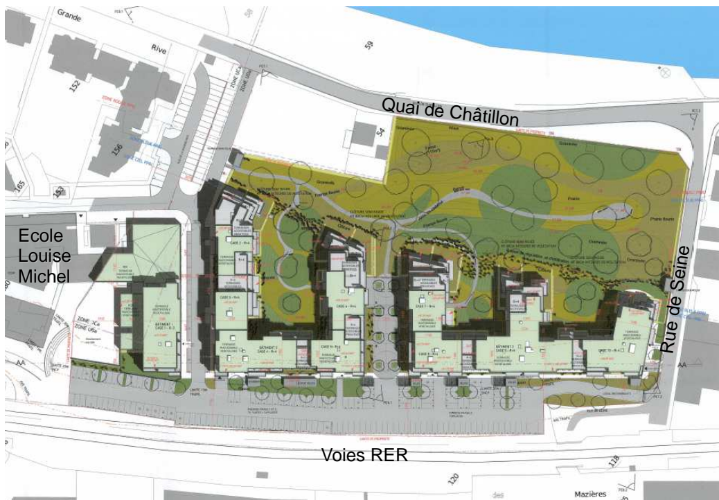
Illustration 2: Plan masse