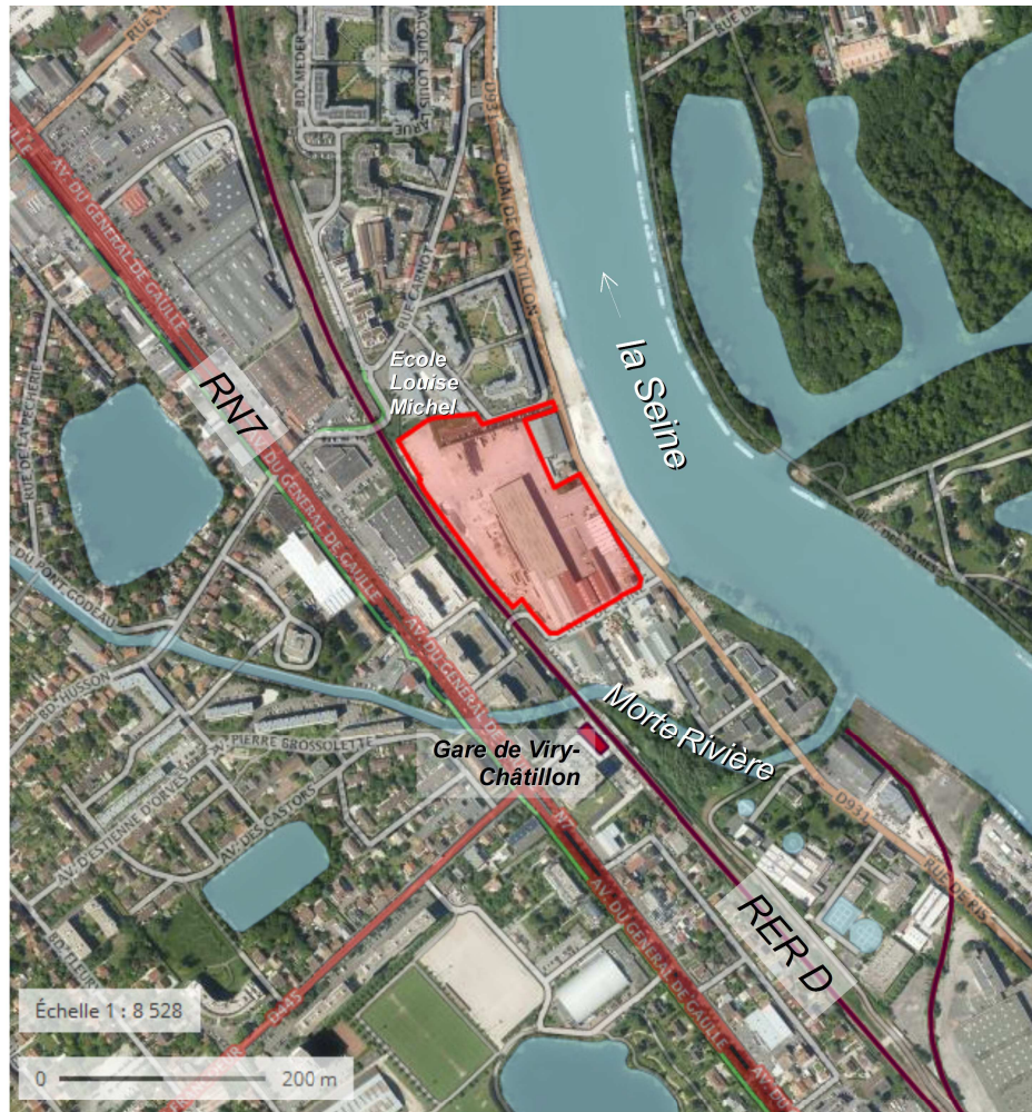
Illustration 1: Site du projet (source : Géoportail, annotations : DRIEE)