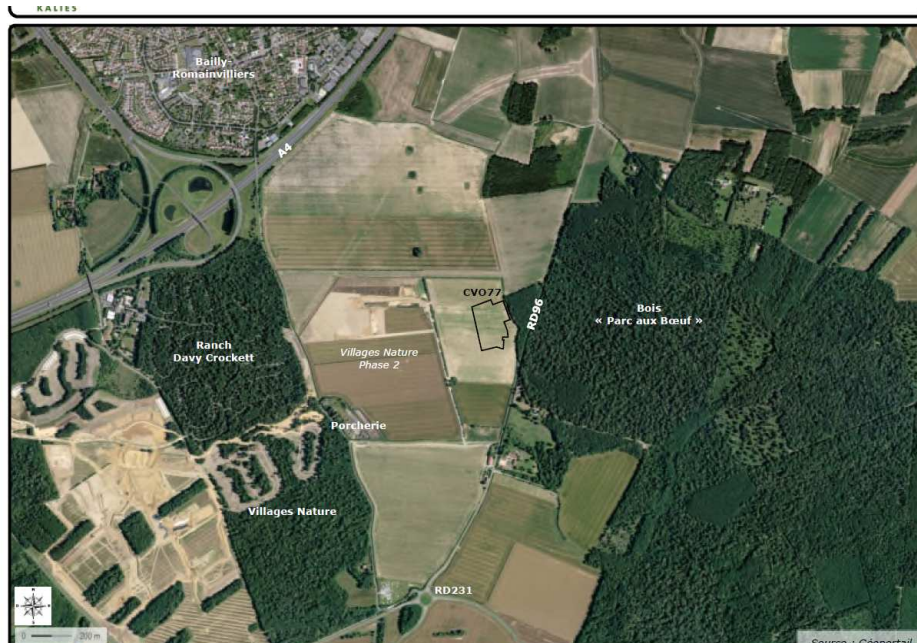
Situation du projet par rapport à Villages Nature