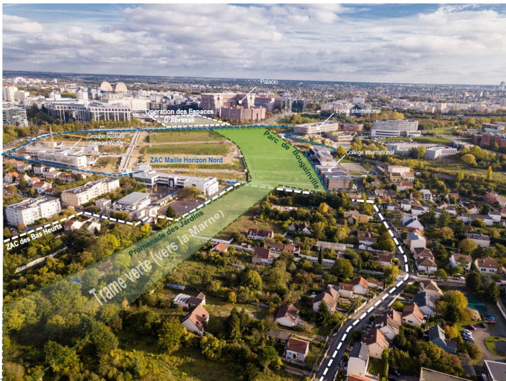
Fig 2. Localisation du site du projet. (vue vers le sud, - limite de la ZAC : pointillés blancs – ZAC Maille Horizon Nord ; bleu)