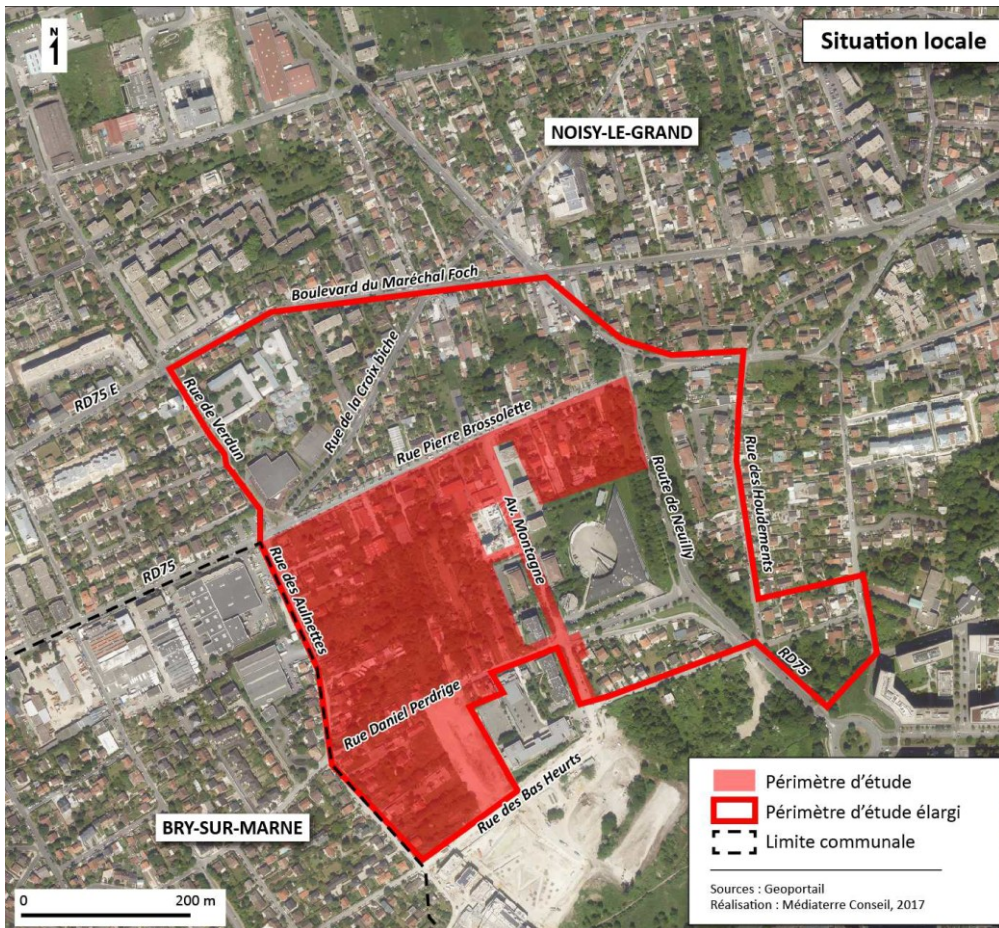
Fig 1 . Périmètre de la ZAC (périmètre d'étude) et périmètre d'étude élargi de l'étude 'impact' (source : étude d'impact )