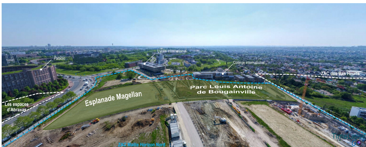
Fig ** Vue drone, juin 2018, de gauche à droite : Les espaces d'Abraxas, de la future esplanade Magellan, du parc Louis Antoine de Bougainville (ZAC Maille Horizon Nord), amorce de la Promenade des Jardins (ZAC des Bas Heurts) (étude d'impact p 383

De même, dans la partie de l'étude d'impact consacrée aux effets cumulés, des vues intéressantes (p383-384) permettent de visualiser certains enjeux paysagers : ces illustrations, qui ne permettent pas d'appréhender le projet mais seulement son environnement, gagneraient à être reproduites dans l'état initial.