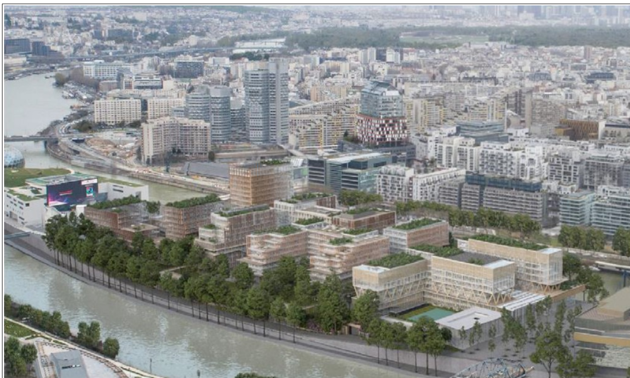
Fig. 3 : visuel d'insertion – source : étude d'impact

Enfin, un jardin de 1,2 ha est aménagé au-dessus du socle, sur la partie sud du projet. Il est indiqué que ce jardin sera « occasionnellement ouvert au public » (pièce A02, p47). Le maître d'ouvrage n'indique pas s'il est prévu de convenir d'horaires précis, en concertation avec les pouvoirs publics.