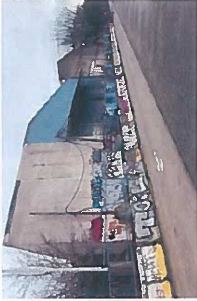
Vue depuis Quai François Mitterrand