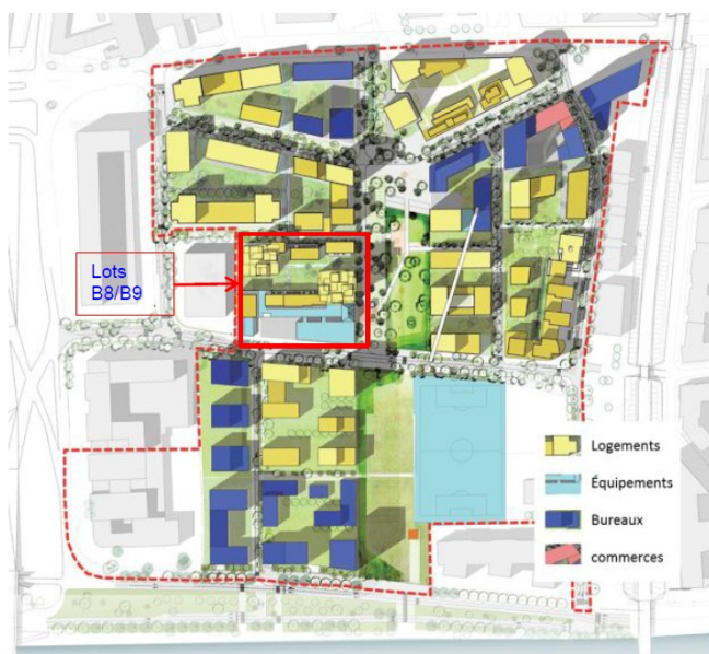
Figure 3 : Programme d'aménagement de la ZAC Parc d'Affaires

de logements (soit 2 000 logements) dont 25 % de logements sociaux), environ 7 000 mètres carrés de commerces et de services, et 7 000 mètres carrés d'équipements publics, dont le groupe scolaire des îlots B8/B9 et une crèche ;