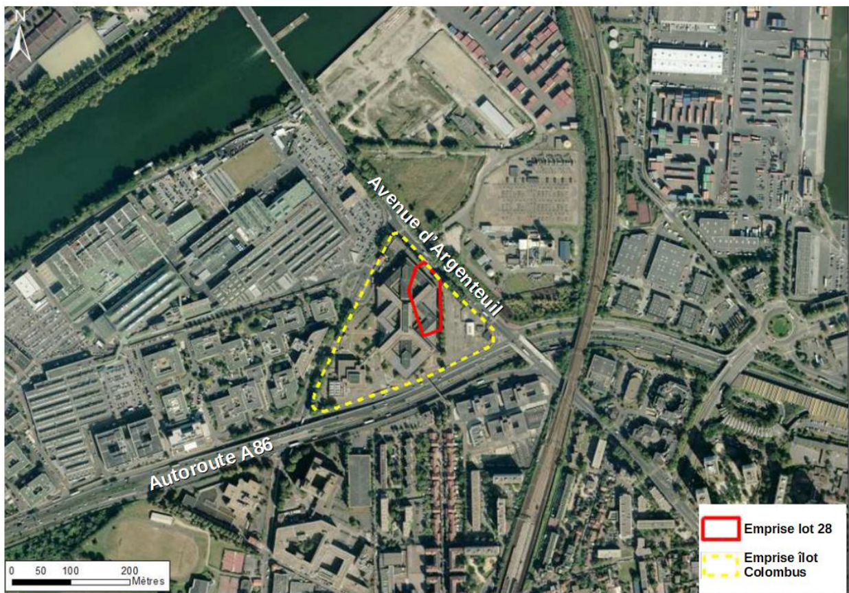
Illustration 2: Emprises de l'îlot Columbus et du lot 28 (source : étude d'impact – page 16, annotations DRIEE)

Après démolition des installations existantes, l'aménagement de l'îlot Columbus, lui-même découpé en plusieurs lots, prévoit environ 544 logements, un pôle multisport 5 et un centre commercial 6 (Illustration 3).