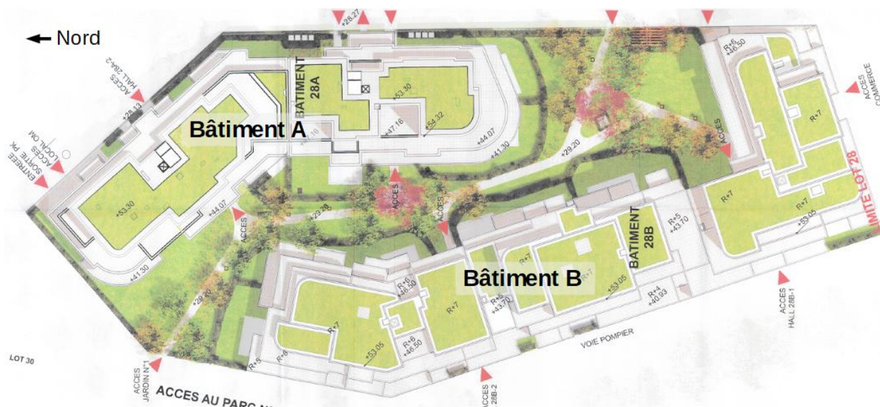
Illustration 4: Projet de construction du lot 28 (source : étude d'impact - page 18, annotations DRIEE) N.B. : orientation inversée (nord à gauche de l'image)