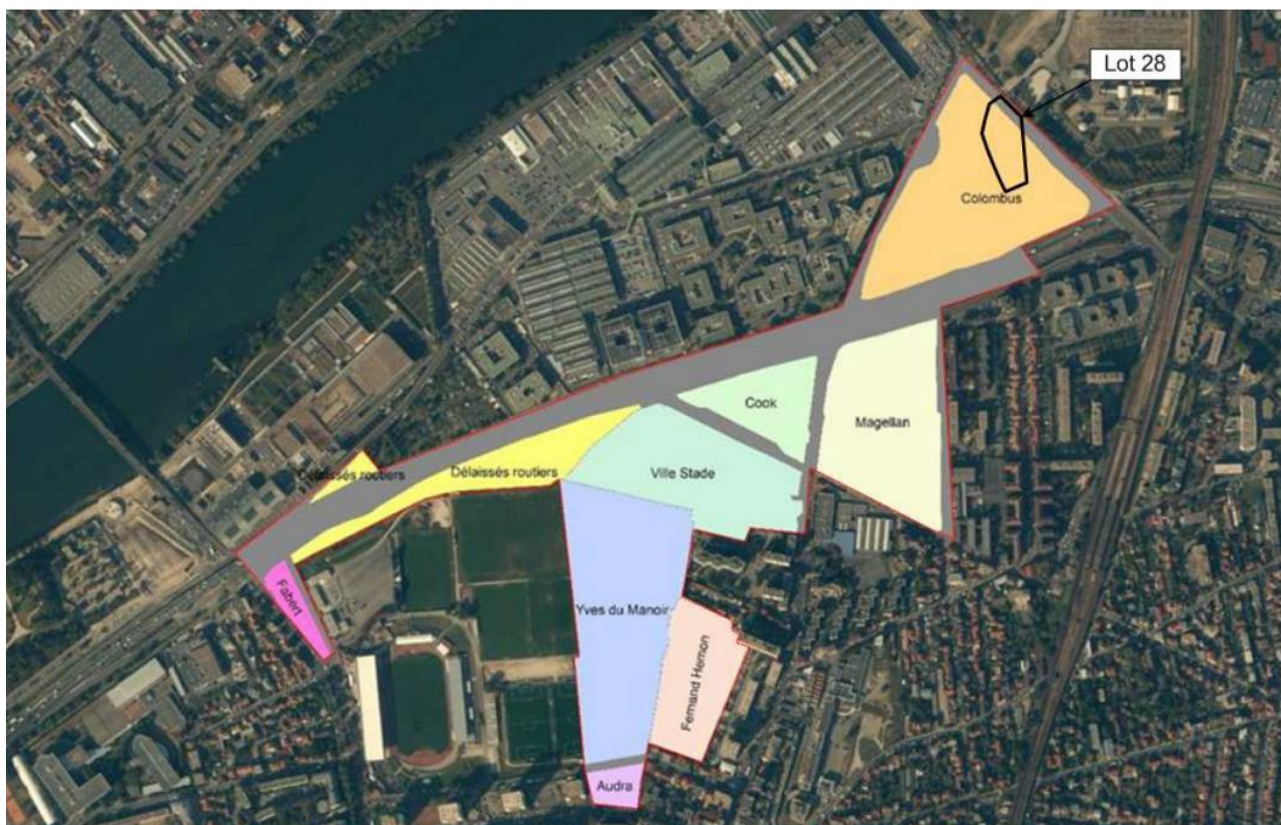
Illustration 1: Localisation des îlots au sein du périmètre de la ZAC de l'Arc Sportif (source : étude d'impact - page 15)

La ZAC de l'Arc Sportif concerne un secteur de 16,2 hectares au nord-ouest de la commune de Colombes, traversé par l'autoroute A86, et caractérisé par la présence d'anciens bâtiments de bureaux et d'un complexe sportif. Elle prévoit la réalisation d'environ 1 920 logements, d'activités tertiaires, de commerces et d'équipements publics (écoles, crèches, gymnase et équipements sportifs). Elle comprend plusieurs îlots, dont l'îlot Columbus, situé au nord de l'autoroute A86 (Illustration 1).