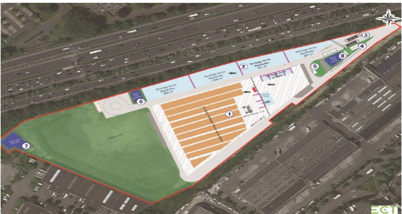
Illustration 2: Plan des installations

L'ensemble du bâtiment est mis en dépression et l'air interne est traité par un système de filtration adapté aux polluants émis par les terres.