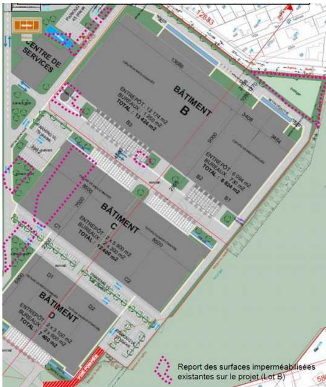
Illustration 6: plan de projet - lot B