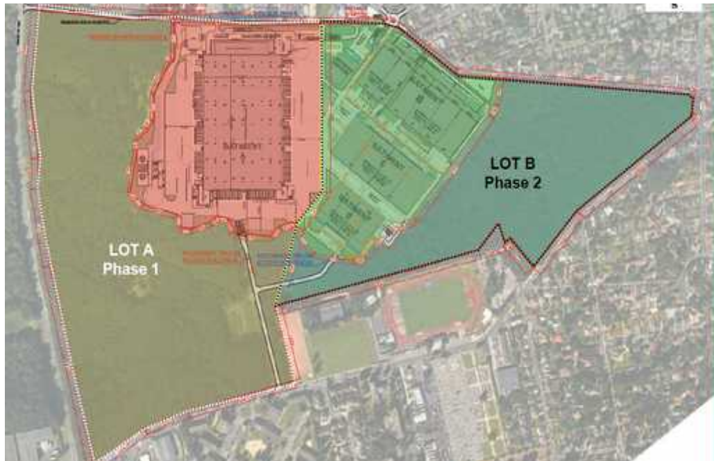
Illustration 3: Plan masse à l'échelle du terrain d'assiette.