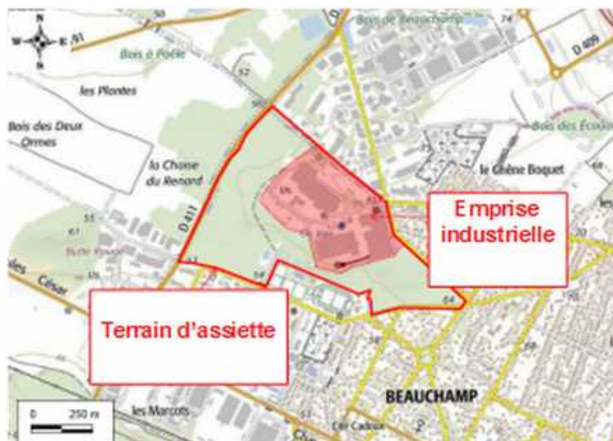
Illustration 2: terrain d'assiette et emprise industrielle – lots A et B

Les données actuelles d'occupation du sol sur le terrain d'assiette diffèrent selon les parties de l'étude d'impact et de ses annexes (tableau n°1). Il convient donc de les harmoniser et de les décliner à l'échelle des lots A et B.