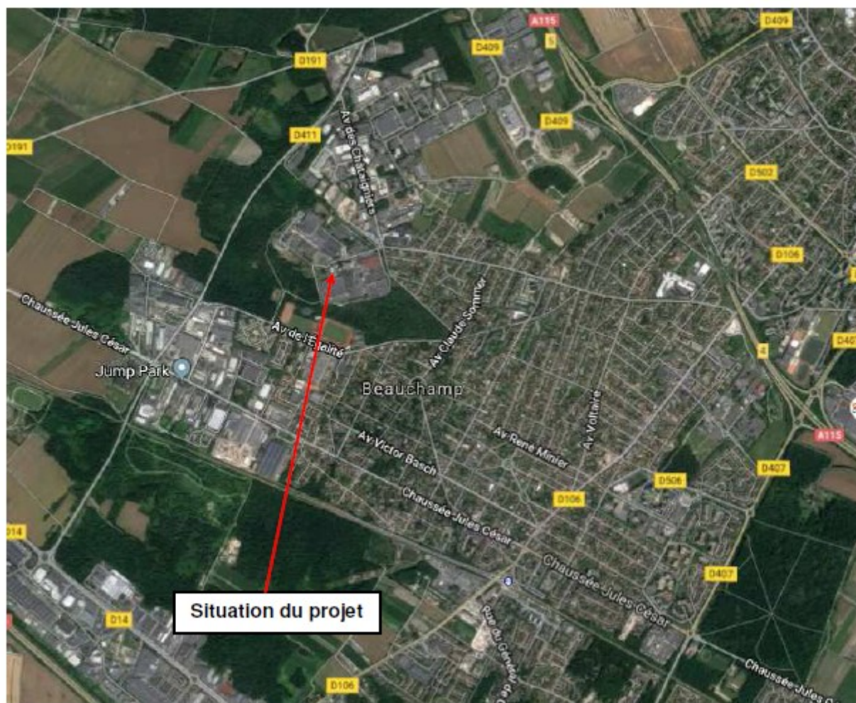
Illustration 7: Situation du projet page 2 de l'étude de trafic