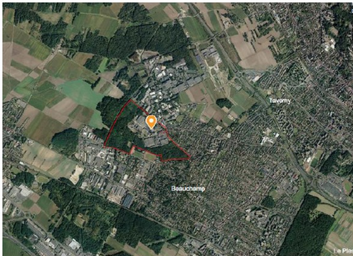
Illustration 1: Vue aérienne annexe 11 de l'étude d'impact