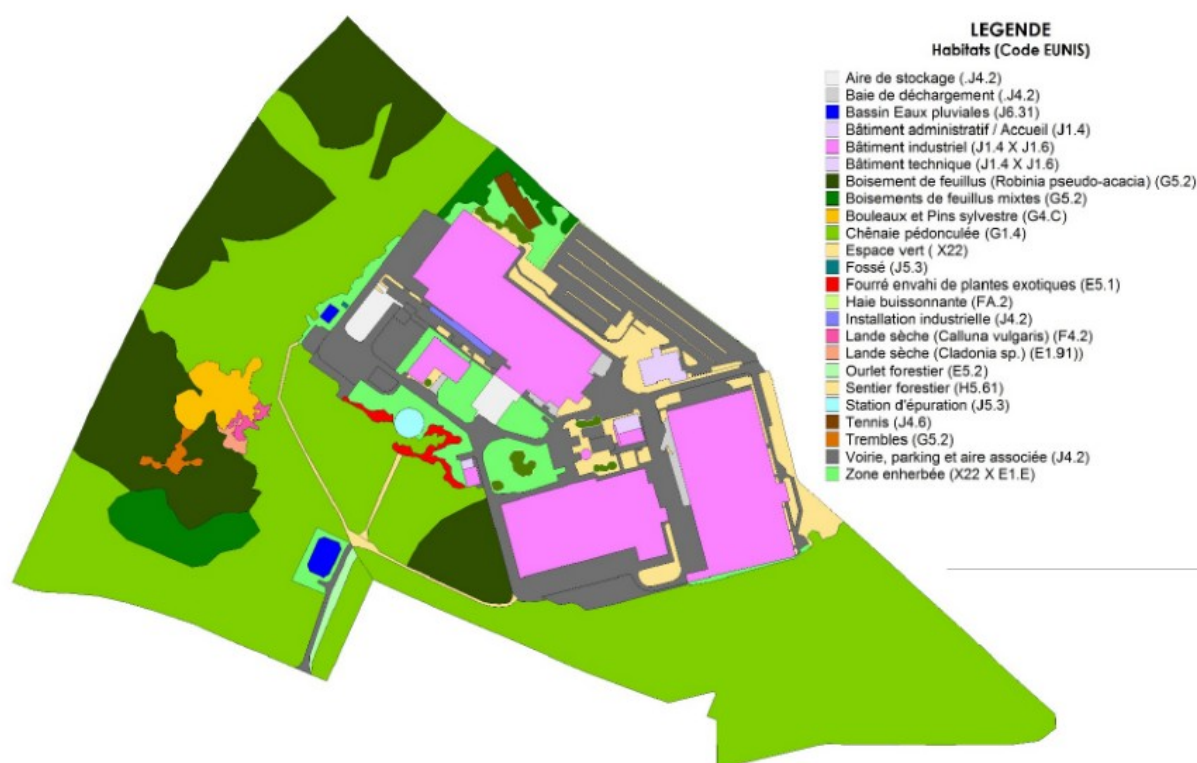
Illustration 8: habitats naturels du terrain d'assiette (étude d'impact)

L'étude d'impact conclut à l'absence d'impact du projet sur les espèces protégées (cf. supra). Toutefois, il convient de justifier l'absence d'impact des travaux sur le lézard des murailles, que l'on pourrait retrouver selon l'étude d'impact dans des amas de pierre liés aux travaux de déconstruction.