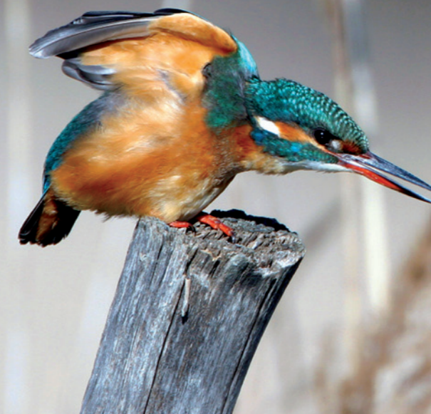
Le Martin-pêcheur d'Europe, hôte des rivières et plans d'eau de la Bassée