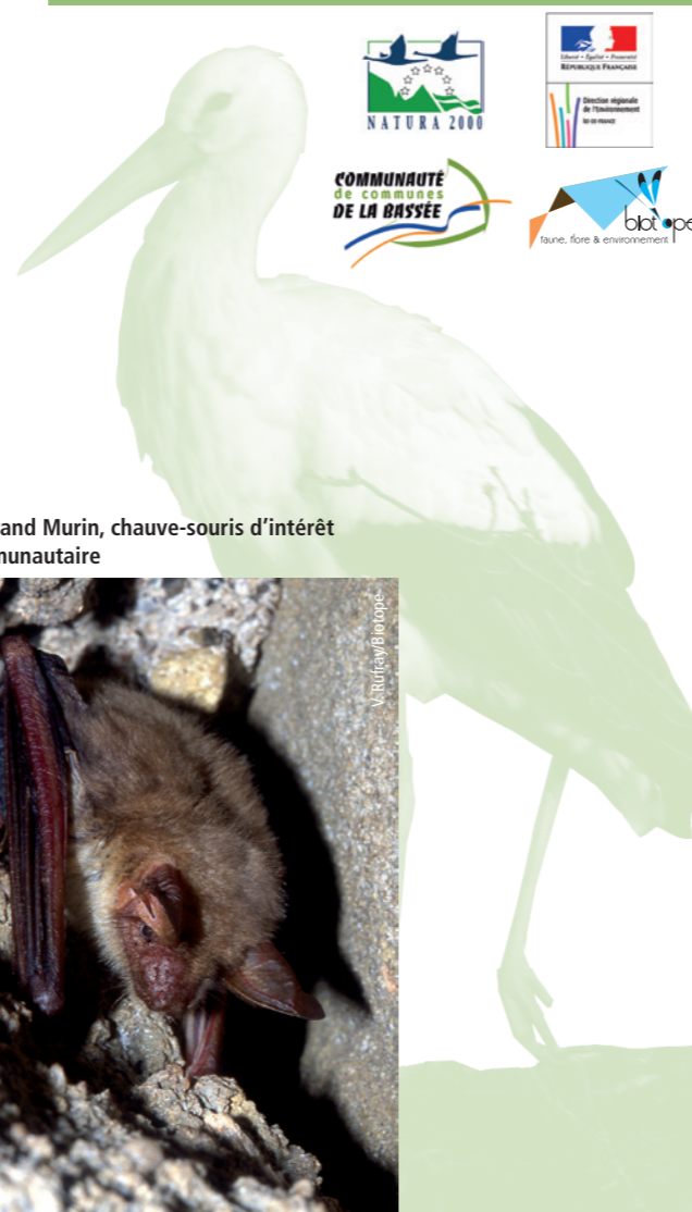
Le Grand Murin, chauve-souris d'intérêt communautaire

(Direction Départementale des Territoires) Roland Rodde et Fabrice Pruvost 288, rue Georges Clémenceau - ZI de Vaux-le-Pénit BP 596 77005 MELUN Cedex roland.rodde@seine-et-marne.gouv.fr fabrice.pruvost@seine-et-marne.gouv.fr 01 60 56 71 71