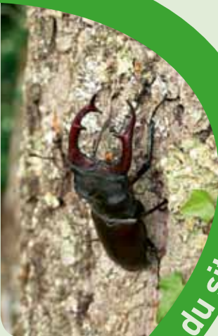
Lucane cerf-volant

erves, ntgé» la e e Les ain ender e nsecte aire, urin ne, uves- niveau ment