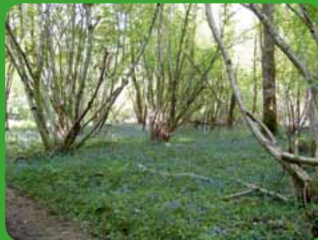
Hêtraie-chênaie à Jacinthe des bois