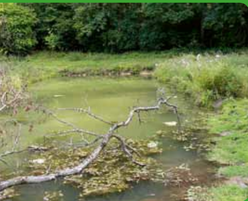
Mégaphorbiaie © Biotope