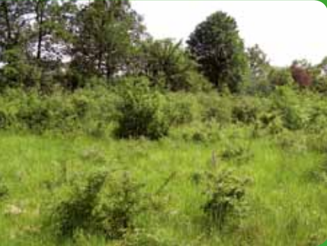
Pelouse calcaire

Les prospections de terrain réalisées en 2011 ont permis de recenser 8 habitats naturels relevant de la directive « habitats », non mentionnés dans le formulaire standard des données (FSD).