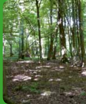
Frênaie-chênaie subatlantique