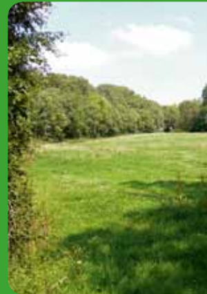
Prairie maigre de fauche