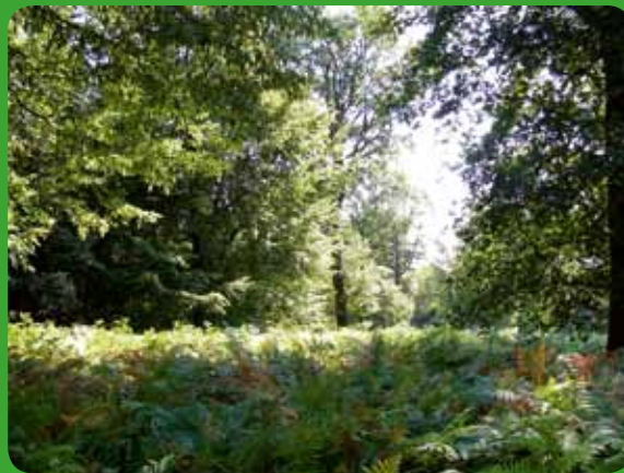
Hêtraie-chênaie à houx