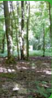
ue à primevères

D'une superficie de 866 ha, le site Natura 2000 « Bois des Réserves, des Usages et de Montgé » se situe au nord-est du département de Seine-et-Marne, à la limite avec le département de l'Aisne. Il s'inscrit dans la petite région agricole de l'Orxois, dans le secteur de l'Ourcq, au nord de la Marne et à l'est de l'Ourcq.