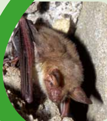
Grand murin

Le site « Bois des Réserves des Usages et de Montgé » a été désigné suite à la présence du Sonneur à ventre jaune, espèce d'amphibien protégée au niveau européen. Les prospections de terrain ont permis d'appréhender la richesse faunistique de ce site. En effet, le Lucane cerf-volant, insecte d'intérêt communautaire ainsi que le Grand Murin et le Grand Rhinolophe, deux espèces de chauves-souris protégées au niveau européen, sont également présents sur le site.