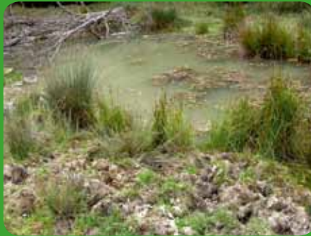
Formation à potamot