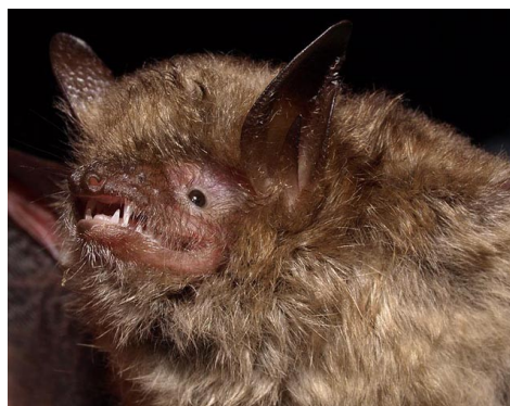
Vespertilion à oreilles échancrées