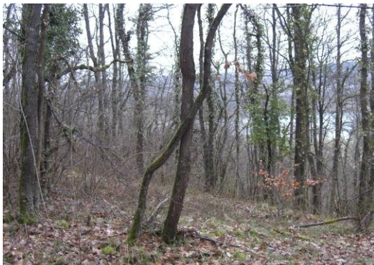
Vue sur la vallée du Fusain

La carrière souterraine de Mocpoix a été désignée comme site Natura 2000 au titre de la directive « Habitats » pour la protection de 5 espèces de chauve-souris inscrites à l'annexe II.