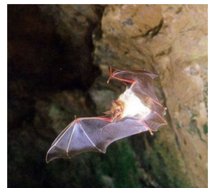
Grand Rhinolophe