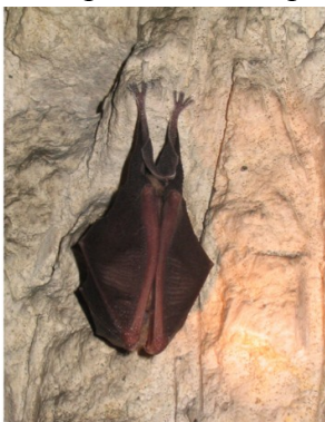
Grand murin

La désignation du site Natura 2000 « Carrière de Mocpoix » est justifiée par la présence de 5 espèces de chiroptères inscrites à l'annexe II de la Directive « Habitats ».