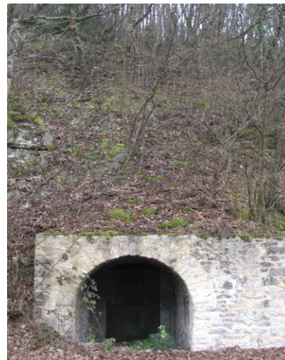
Entrée de la carrière