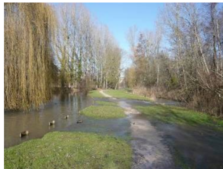
Vallée du Fusain

La carrière de Mocpoix se trouve dans la vallée du Fusain. Le site est constitué de forêts caducifoliées et dans une moindre mesure de landes, broussailles, recrus, maquis et garrigues, phrygana. Elle fait partie d'une ZNIEFF de type II. Depuis 1999, les deux parcelles situées au-dessus de la carrière forment un Espace Naturel Sensible géré par le département.