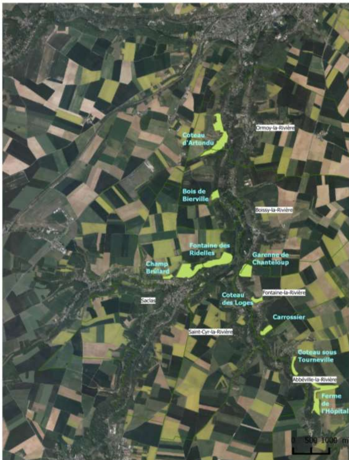
Figure 1 : Carte localisant les sous-sites du site Natura 2000 des Pelouses Calcaires de la Haute Vallée de la Juine