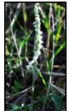
Figure 8: Spiranthes spiralis , 10/09/2015. N2000 Juine

En 2015 un pied de Spiranthes spiralis avait été trouvé (Figure 8). Cette espèce était considérée comme disparue dans l'Essonne, en effet la dernière mention dans le département date de 1889 (source : CBNBP). C'est une espèce protégée et considérée en danger d'extinction sur la liste rouge régionale. En 2016, plusieurs passages ont été effectués pour retrouver cette espèce, sans succès.