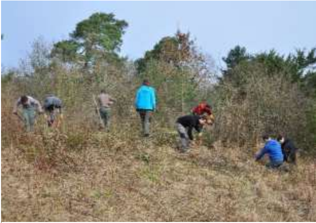
Figure 3: Chantier nature organisme de formation