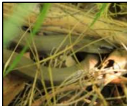
Figure 5 : Orvet fragile

Résultat : Les nouvelles plaques ont permis d'améliorer les connaissances sur le site. En effet, deux nouvelles zones de présences ont pu être découvertes pour la Coronelle lisse ( Coronella austriaca ) ainsi qu'une nouvelle zone pour l'Orvet fragile ( Anguis fragilis ).