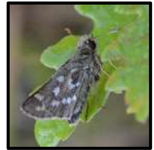
Figure 7 : Hesperia comma

La Virgule ( Hesperia comma ) espèce qui n'avait pas été vue depuis 2013 sur le territoire francilien, a été observée sur le Coteau d'Artondu et à proximité de la Ferme de l'Hôpital en août 2016. C'est une espèce très rare en Ile-de-France, considérée comme en danger d'extinction sur la liste rouge régionale.