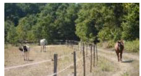
Figure 9 : Pâturage équin – Le Carrossier

Le Carrossier : Pâturage équin : apport de foin, piétinement.