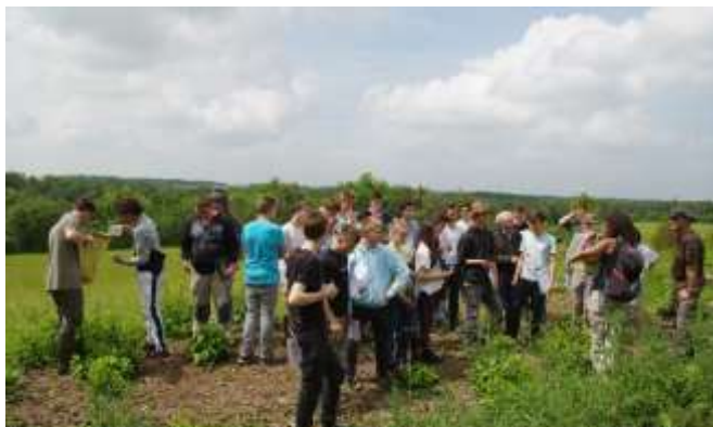
Figure 13 : Animation scolaire, 06/06/2016