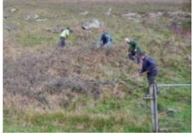
Figure 2 : Chantier nature bénévole