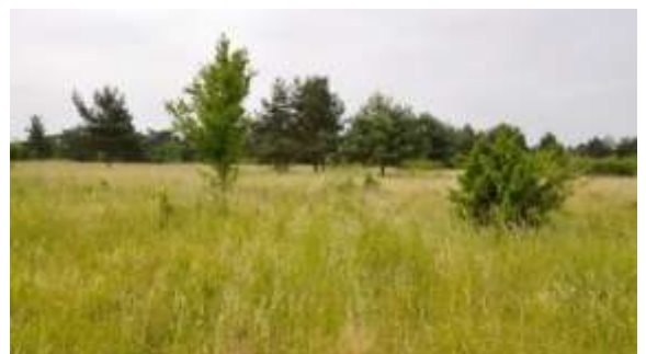
Figure 4 : Transect Fontaine des Ridelles

Un transect a été mis en place en 2015 (Figure 4). Cette année, aucun transect n'a pu être réalisé, car l'animation du site a débuté tardivement, ne laissant pas de temps pour effectuer le suivi à la période indiquée dans le protocole. Du matériel a été acquis afin de localiser durablement les transects.