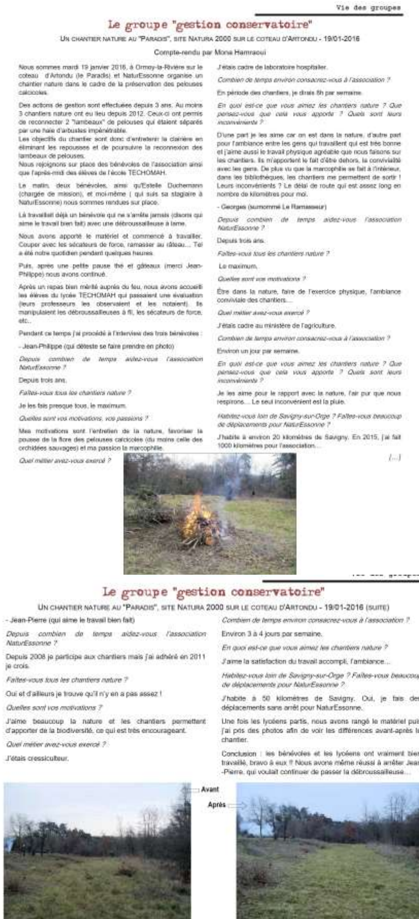
Figure 11: Article sur le site Natura 2000- lettre d'information n°67 NaturEssonne

Un article a été rédigé dans la lettre d'information n°67 publiée en juin 2016 de NaturEssonne concernant les chantiers nature sur le site Natura 2000 (Figure 11).