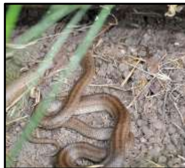
Figure 6 : Coronelle lisse