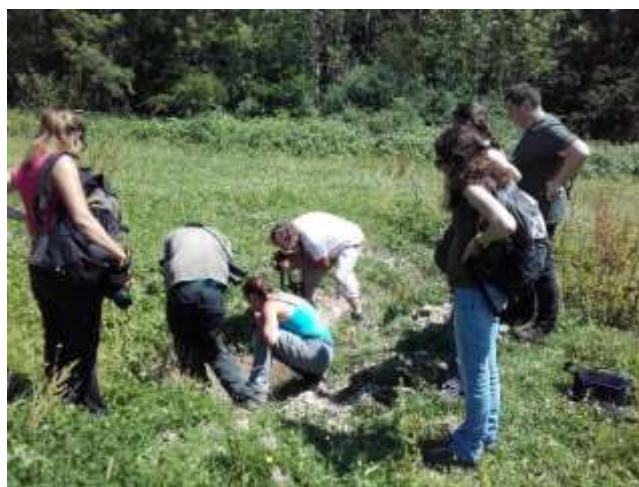
Figure 10 : Observation du sonneur à ventre jaune sur le site Natura 2000 de la Vallée du Petit Morin

L'après-midi a été consacré à des prospections naturalistes (Sonneur à ventre jaune et Cuivré des marais), en lien avec le projet d'extension du site Natura 2000 de la Vallée du Petit Morin.