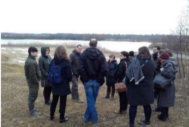
Figure 9 : Visite de la RNR du Grand Voyeux par la Commission Européenne

Début 2017 une délégation de la Commission Européenne responsable de la gestion du FEADER a été reçue par la Région Île de France. Une équipe constituée des gestionnaires du FEADER au niveau régional et au niveau européen est venue visiter la réserve naturelle régionale du Grand Voyeux le 1 er février 2017. L'objectif était de découvrir sur le terrain les travaux financés dans le cadre des contrats Natura 2000 ni agricoles ni forestiers.