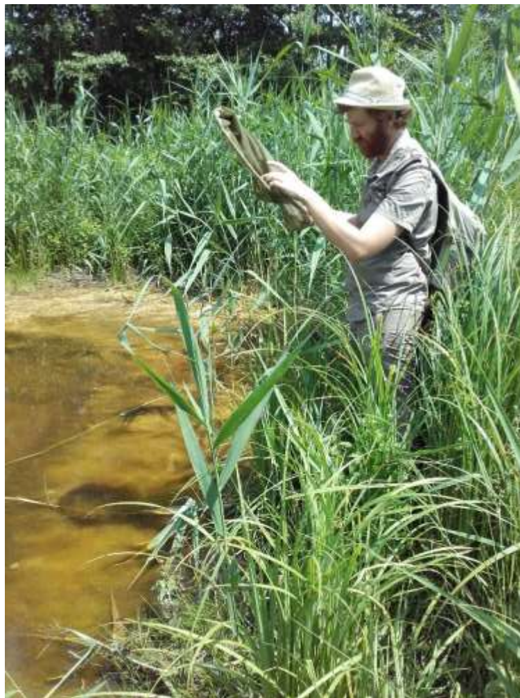
Figure 2 : Inventaire des odonates dans le Bois de Vaires-sur-Marne

La suite de ce bilan est structurée selon les missions ci-dessus, et se propose de détailler les réalisations de 2017.