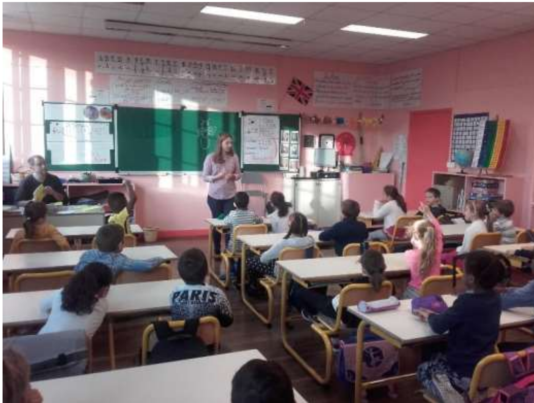
Figure 8 : Animation réalisée par l'OPIE à l'école Paul Bert de Vaires-sur-Marne

La chargée de mission Natura 2000 a organisé des sessions de sensibilisation des scolaires autour du Bois de Vaires, pour les informer de la richesse écologique du Bois de Vaires notamment en termes d'insectes, et de son classement Natura 2000. Les thèmes étaient en fonction des âges : « la place des insectes dans la nature », « les fourmis », « la chaîne alimentaire dans la forêt ». Cette prestation a été réalisée par deux animateurs de l'OPIE et est décrite dans le Tableau 6 .