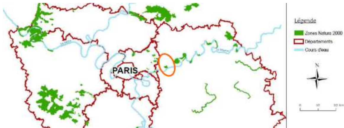
Figure 1 : Localisation du site du Bois de Vaires-sur-Marne

Le Document d'objectifs (DocOb) porte sur la Zone Spéciale de Conservation FR1100819 du « Bois de Vaires-sur-Marne ». Il a été rédigé par OGE et La DIREN IDF, et validé par l'arrêté préfectoral du 3 Mars 2009.