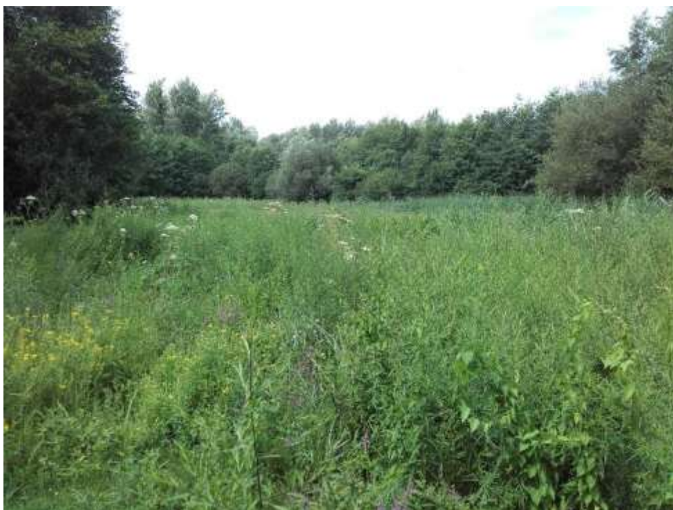
Figure 2 : Mégaphorbiaie du Bois de Vaires envahie par l'Aster à feuille de saule

Un contrat Natura 2000 a été signé par l'AEV en 2016 pour la fauche avec export de la mégaphorbiaie du Bois du Gué de l'Aulnay, dit Bois du Marais (2,4 ha).