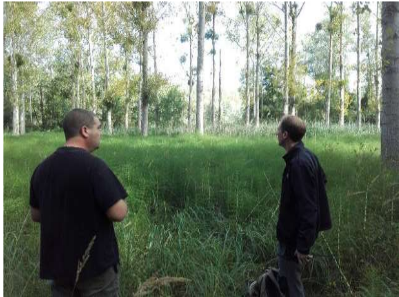
Figure 5 : diagnostic du CBNBP dans le bois de Brou

Le 22 juin 2017, Thomas Bitsch de la Société Française d'Odonatologie a effectué un inventaire des odonates dans les bois de Brou et de Vaires. Plusieurs espèces patrimoniales d'odonates et de lépidoptères ont été observées à Vaires : Coenagrion scitulum , Orthetrum brunneum , et à Brou : Calopteryx virgo , Apatura ilia et Callimorpha dominula . Les données ont été saisies dans Cettia, la base de données naturaliste gérée par l'Agence régionale pour la biodiversité.