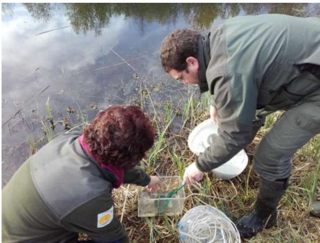
Figure 6 : Suivi des amphibiens dans les Bois de Brou et Vaires

Le Triton crêté a été retrouvé à plusieurs reprises dans le Bois de Brou en 2017, ainsi que présenté dans le Tableau 5 .