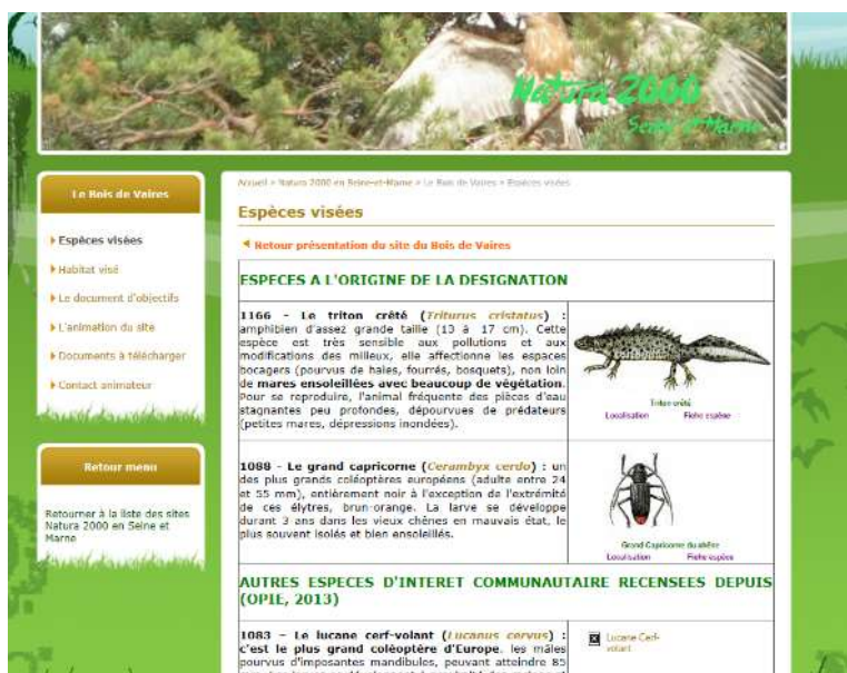
Figure 7 : Page du site internet dédiée à la présentation des espèces du site

Le site Internet de Natura 2000 en Seine-et-Marne : http://seine-et-marne.n2000.fr/natura-2000-en-seine-et-marne/le-bois-de-vaires présente le dispositif Natura 2000 et les enjeux spécifiques du bois de Vaires. Il donne également des compléments d'informations aux usagers, notamment par rapport aux évaluations des incidences.