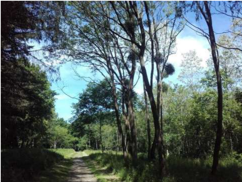
Figure 4 : Bois de Vaires communal

Le 18 décembre 2017, la chargée de mission Natura a rencontré les services techniques de la ville de Vaires-sur-Marne, notamment pour leur présenter le dispositif de la charte Natura 2000.