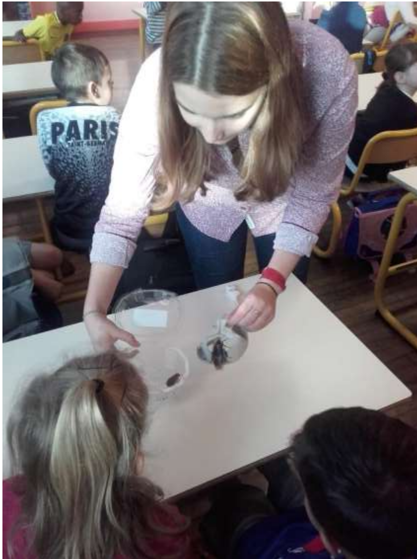
Figure 23 : Animation réalisée par l'OPIE à l'école Paul Bert de Vaires-sur-Marne