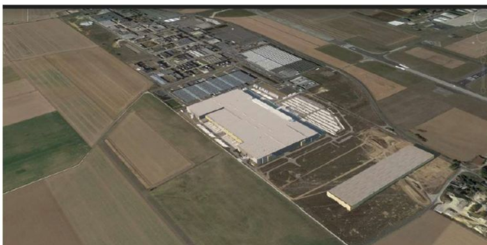
FIGURE 4: VISUEL DE L'INSERTION DU PROJET DANS LA ZAC (P. 162)