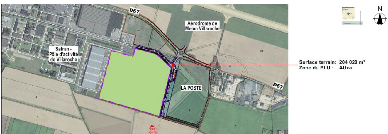
2: PLAN DE SITUATION DU PROJET DE PLATEFORME LOGISTIQUE DE LA SOCIÉTÉ GEMFI (PIÈCE 13 ÉLÉMENTS GRAPHIQUES – PC 1)

Le projet prévoit la construction d'une plateforme logistique de 140 366 m 2 de surface de plancher, d'un volume estimé de l'ordre de 2 000 000 m 3 , divisé en onze cellules en vue de stocker, trier, acheminer, préparer et