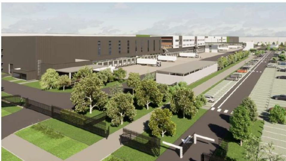
FIGURE 3: VISUEL DE L'INSERTION DU PROJET DANS LE PAYSAGE (P. 156)

La livraison du site est prévue en 2023 et le démarrage de l'activité à compter de 2024.