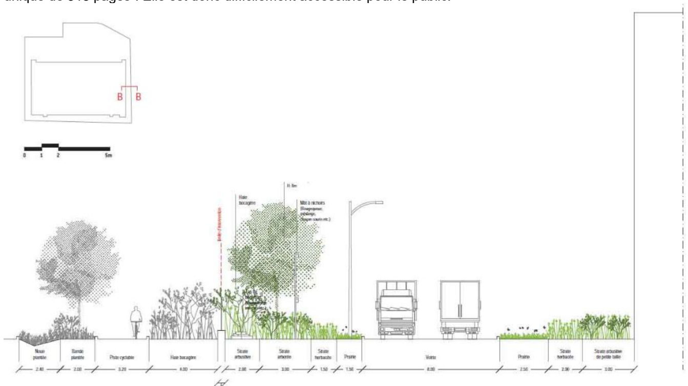
FIGURE 7: « LISIÈRE VOIE VERTE », COUPE FIGURANT, À GAUCHE, LA CONTINUITÉ ENTRE LES AMÉNAGEMENTS DU PROJET ET L'ESPACE PUBLIC DE LA RD 35) AINSI QUE LE PROSPECT DU BÂTIMENT, À DROITE (P. 168).

La MRAe souligne la qualité de la conception des aménagements extérieurs. Elle porte principalement sur quatre points : le maillage des allées piétonnes et pistes cyclables, l'aménagement du parking en pavés herbés et traversé par des noues plantées, la recherche de grandes surfaces plantées « d'un seul tenant » qui permettent le développement d'une végétation multi-strates ainsi que la conception des lisières, notamment en périphérie, en lien avec les aménagements sur l'espace public (au nord-est et à l'est voir fig. 7). Toutefois la MRAe considère que l'étude d'impact explicite insuffisamment le « parti d'aménagement paysager », au-delà des éléments graphiques (p. 163 et suivantes). Par ailleurs, si à la page 38 du résumé de l'étude d'impact, la reproduction du « plan des espaces paysagers » (dont la légende est illisible) est sourcée : « notice paysagiste – Sensomoto Paysagistes », cette notice ne figure pas sous ce nom dans le dossier et est incluse dans un fichier unique de 518 pages 9 . Elle est donc difficilement accessible pour le public.