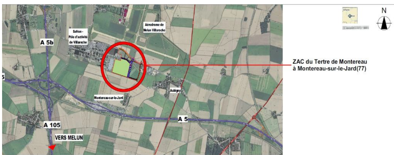
1: PLAN DE SITUATION DE LA ZAC DU « TERTRE DE MONTEREAU » (PIÈCE 13 ÉLÉMENTS GRAPHIQUES – PC 1)