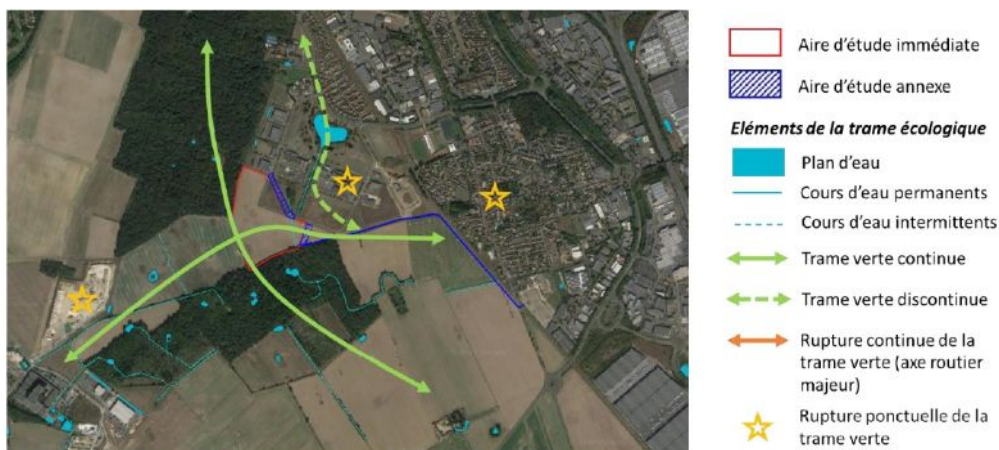
Figure 5: Éléments de la trame verte et bleue locale (p. 26 de la pièce 4bis "Étude biodiversité")

Comme indiqué précédemment, les enjeux liés aux milieux naturels et à la biodiversité sont principalement traités dans l'étude biodiversité (pièce 4bis du dossier). Cette étude relève que, bien que non inclus dans des périmètres d'inventaires ou de protection, le site présente une sensibilité écologique du fait de sa proximité immédiate avec le bois des Folies et le bois de la Tombe, qui sont désignés comme des espaces naturels sensibles (ENS) par le département de l'Essonne et inscrits comme espaces boisés classés (EBC) dans le PLU de la commune de Lisses. Le site est aussi situé dans une zone de mares et mouillères et localisé à la croisée de deux corridors de la trame verte locale identifiés par le schéma régional de cohérence écologique d'Île-de-France (SRCE) (Figure 5). Bordé au sud et à l'ouest par des lisières forestières et des haies, il constitue un couloir de déplacement pour la faune. Il possède donc une fonctionnalité écologique qualifiée de « non négligeable » dans l'étude.