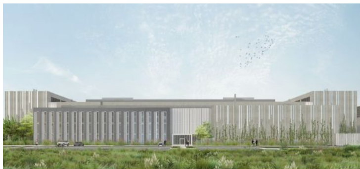
Figure 7: Visuel d'insertion du projet : vue depuis le nord (p. 165)

La MRAe recommande d'engager une réflexion supplémentaire sur les conditions d'implantation des deux bâtiments en limite des espaces agricoles et forestiers. -