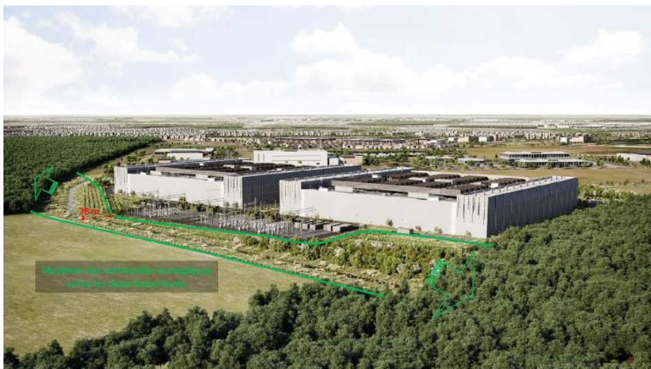
Figure 6: Principe de corridor écologique entre les bois (mesure de réduction n°9 – p.104 de l'étude biodiversité )

Le projet prévoit en outre une mesure d'accompagnement consistant à capturer et déplacer plusieurs espèces d'insectes protégées, dont l'Oedipode turquoise, le Grillon d'Italie et la Mante religieuse inféodées aux pelouses sèches. La mise en œuvre de cette mesure est déléguée à l'aménageur de la ZAC (Grand Paris Aménagement), qui doit identifier les parcelles favorables à l'accueil de ces espèces dans le cadre d'une mise à jour de l'étude d'impact de la ZAC (p. 116 de l'étude). Pour la MRAe, l'intérêt de ces déplacements d'individus pour la conservation des populations de ces espèces aux abords du site doit être établi. De plus ce déplacement d'individus d'espèces protégées nécessite a priori une dérogation au titre du 4° de l'article L. 411-2 du code de l'environnement, à délivrer dans le cadre de la présente autorisation environnementale.