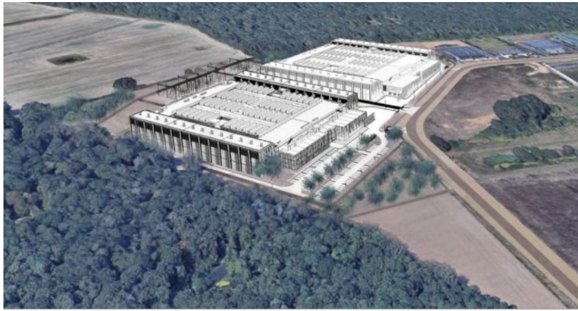
Figure 3: Vue globale du projet - vue depuis le sud-est vers le nord-ouest (p. 29 – pièce 2 Notice de présentation)