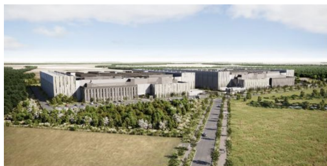
Figure 8: Visuel d'insertion du projet : vue depuis l'est (p. 166)