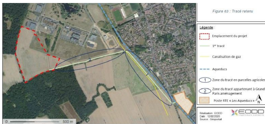
Figure 2: Localisation du projet et du tracé de raccordement électrique (p. 131)