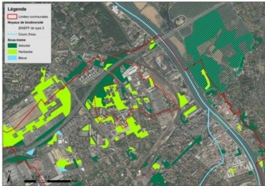
Figure 4: Continuités écologiques au sein de la zone d'étude (étude d'impact, p. 150)

En décembre 2019, une étude « Faune, flore, habitat » a révélé la présence de sept espèces floristiques patrimoniales ne bénéficiant pas d'un statut de protection, de 25 espèces d'oiseaux protégées et de huit espèces d'oiseaux patrimoniales. Cette étude a par ailleurs permis de distinguer des éléments de continuités écologiques sur le site (p. 149).