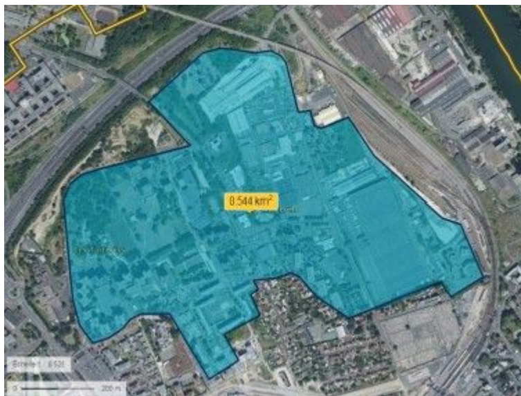
Figure 1: Périmètre du projet de renouvellement urbain des Tarterêts (étude d'impact, p. 51)

Le quartier des Tarterêts fait donc l'objet d'un nouveau projet de renouvellement urbain inscrit au NPNRU 2 . Les grands axes de ce projet consistent à diversifier l'habitat par démolition et reconstruction de logements et à requalifier les espaces publics.