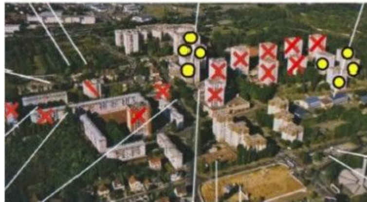
Figure 2: Démolitions réalisées et prévues dans le cadre du renouvellement urbain