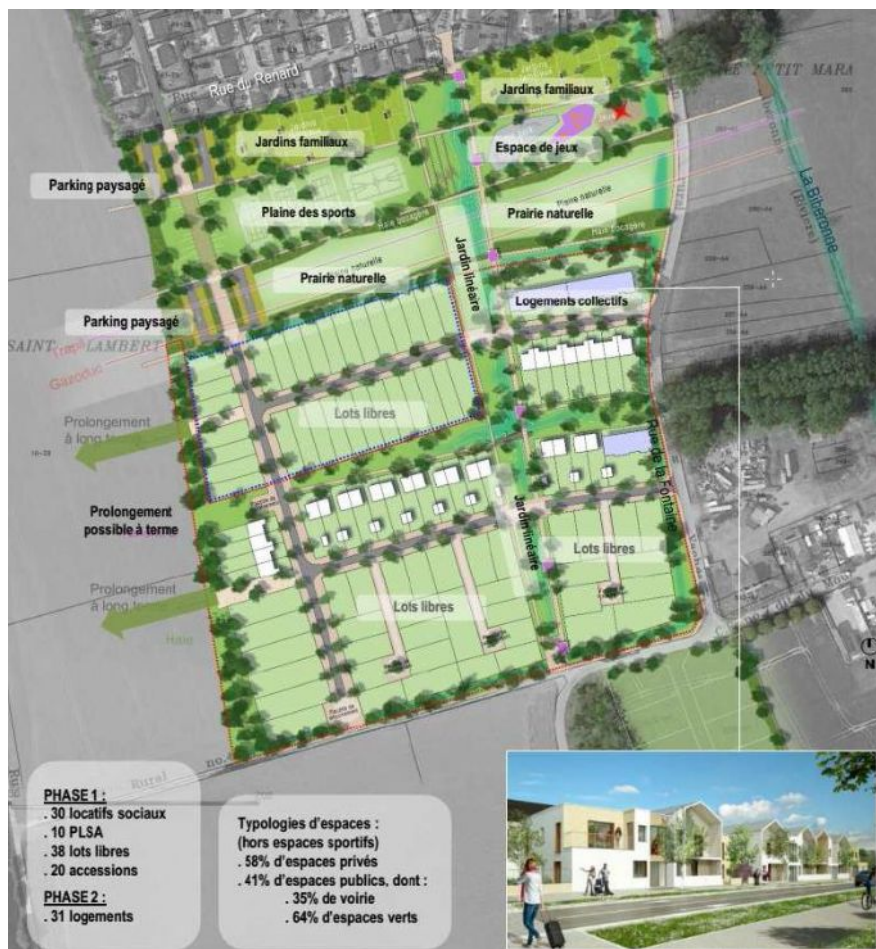
Figure 2: Plan masse de la ZAC

L'emprise de la ZAC est de 11,4 hectares 2 . La ZAC a vocation à accueillir 129 3 logements, composés de maisons individuelles en majorité et de quelques logements collectifs. La partie nord de la ZAC est comprise dans la zone C du plan d'exposition au bruit (PEB) de l'aéroport ce qui ne permet pas l'implantation de nouveaux logements. Une prairie naturelle, une plaine des sports, un espace de jeux, des parkings et des jardins familiaux y seront par conséquent aménagés.