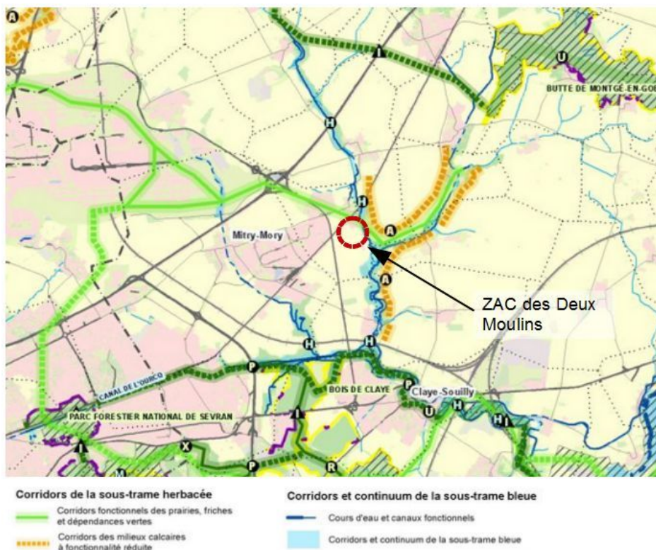
Figure 4: Localisation du projet et SRCE

L'étude d'impact présente le schéma régional de cohérence écologique (SRCE) d'Île-de-France en rappelant bien les enjeux propres aux milieux agricoles, et en indiquant que la ZAC n'est pas concernée par un enjeu particulier de conservation. La carte des « objectifs de préservation » du SRCE, présentée dans l'étude d'impact, indique la présence du corridor alluvial lié aux vallées de la Biberonne et de la Beuvronne. L'autorité environnementale relève, toutefois, que la carte des « composantes de la trame verte et bleue », non présentée, identifie une continuité écologique fonctionnelle de la sous-trame herbacée (prairies, friches et dépendances vertes), qu'il convient également de préserver. Cette continuité, qui est matérialisée dans le SRCE par un tracé de principe, concerne le secteur de la ZAC dont la limite est en lisière de ce corridor.