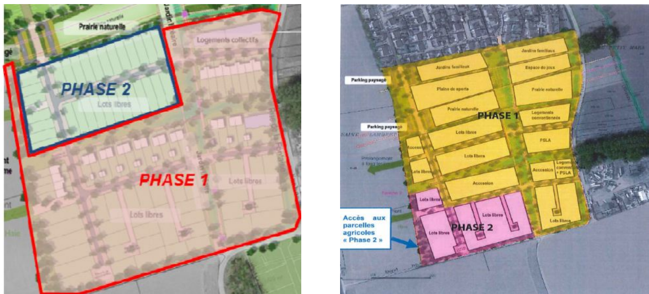
Figure 3: Phasage de la ZAC : à gauche, phasage initial, à droite, phasage présenté dans le complément n° 3

L'autorité environnementale invitait dans son avis de 2016, le maître d'ouvrage à proposer un phasage qui permette de maintenir autant que possible l'activité agricole et l'accès aux parcelles. Le complément n° 3 précise que, suite à cet avis, le phasage est modifié pour permettre aux agriculteurs d'accéder aux parcelles de la phase 2. La MRAe en prend note.