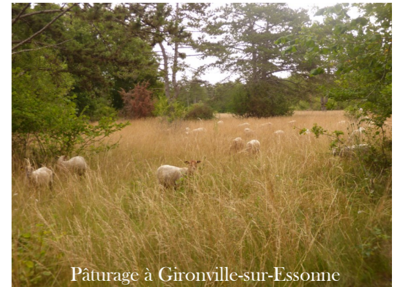
Pâturage à Gironville-sur-Essonne

Pour cela, NaturEssonne a fait appel à la Ferme de Beaumont, ouvrant ainsi la voie à un retour du pâturage en Essonne. Cette pratique permettait historiquement d'entretenir les pelouses calcaires.