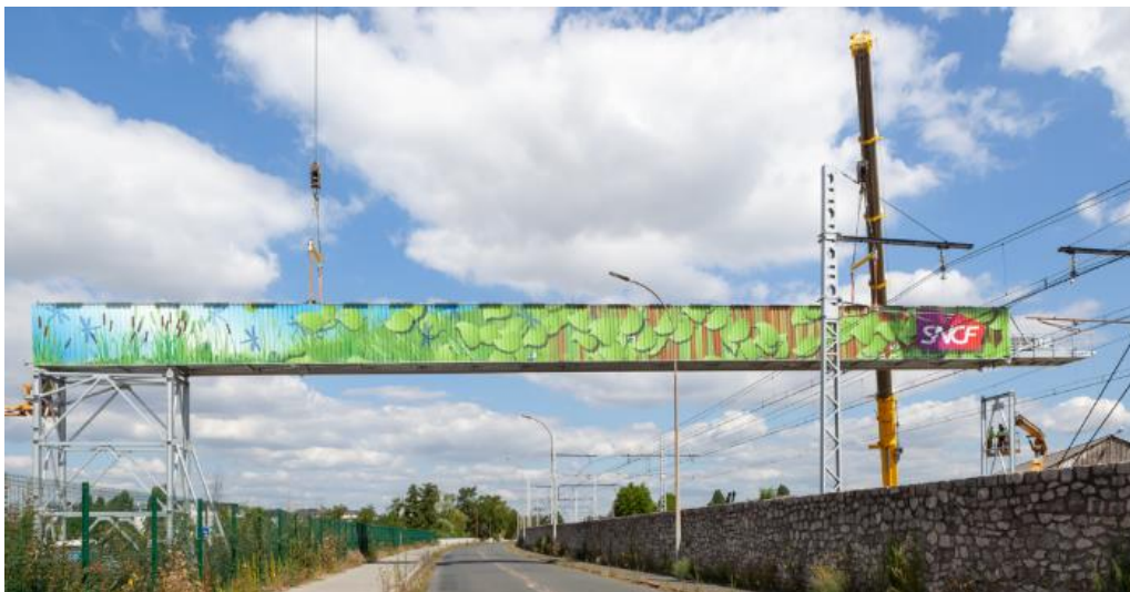
Convoyeur, extraction des déblais du Technicentre Villeneuve Demain

Une nouvelle étape majeure vient d’être franchie dans le cadre du projet Villeneuve Demain , la modernisation du Technicentre de Villeneuve Prairie, dédié à la maintenance des matériels roulants du RER D et de la Ligne R. Un convoyeur surplombant l’avenue de Choisy et les voies ferrées est mis en service entre le site ferroviaire et le Port Bergeron situé sur la commune de Villeneuve Saint-Georges permettant ainsi l’évacuation de près de 10 000 tonnes de déblais du chantier par voie fluviale.