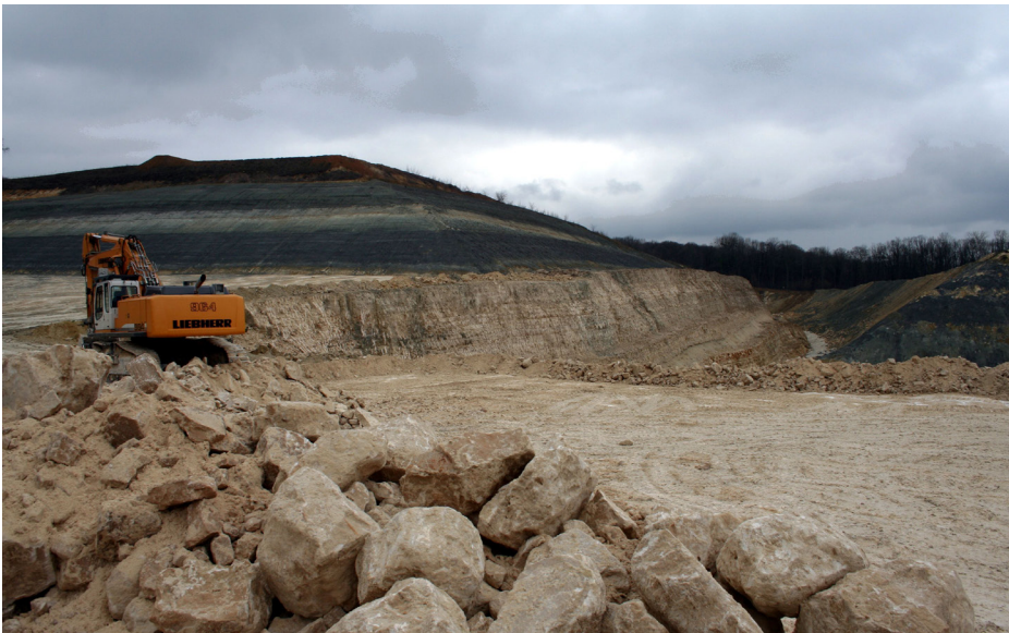
L'exploitation de gypse de la carrière du Bois des sables, Saint Soupplets

Préserver à la fois les fonctionnalités du patrimoine vert et paysager de la butte et la capacité d'extraction du gypse tel est l'enjeu du plan de paysage et ressources de la butte de Montgé.