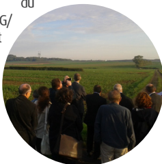
Visite du site par le comité de pilotage, mars 2012

Élaboré avec l'appui du groupement Omnibus/2G/Roumet, le plan est le résultat d'un processus collectif. Son avancement a été soumis régulièrement à l'examen du comité de pilotage, constitué à cet effet et a fait l'objet d'une visite des partenaires sur le site et d'ateliers thématiques.