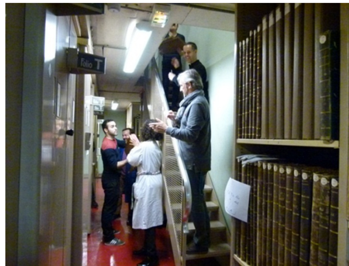
Évacuation et stockage des collections