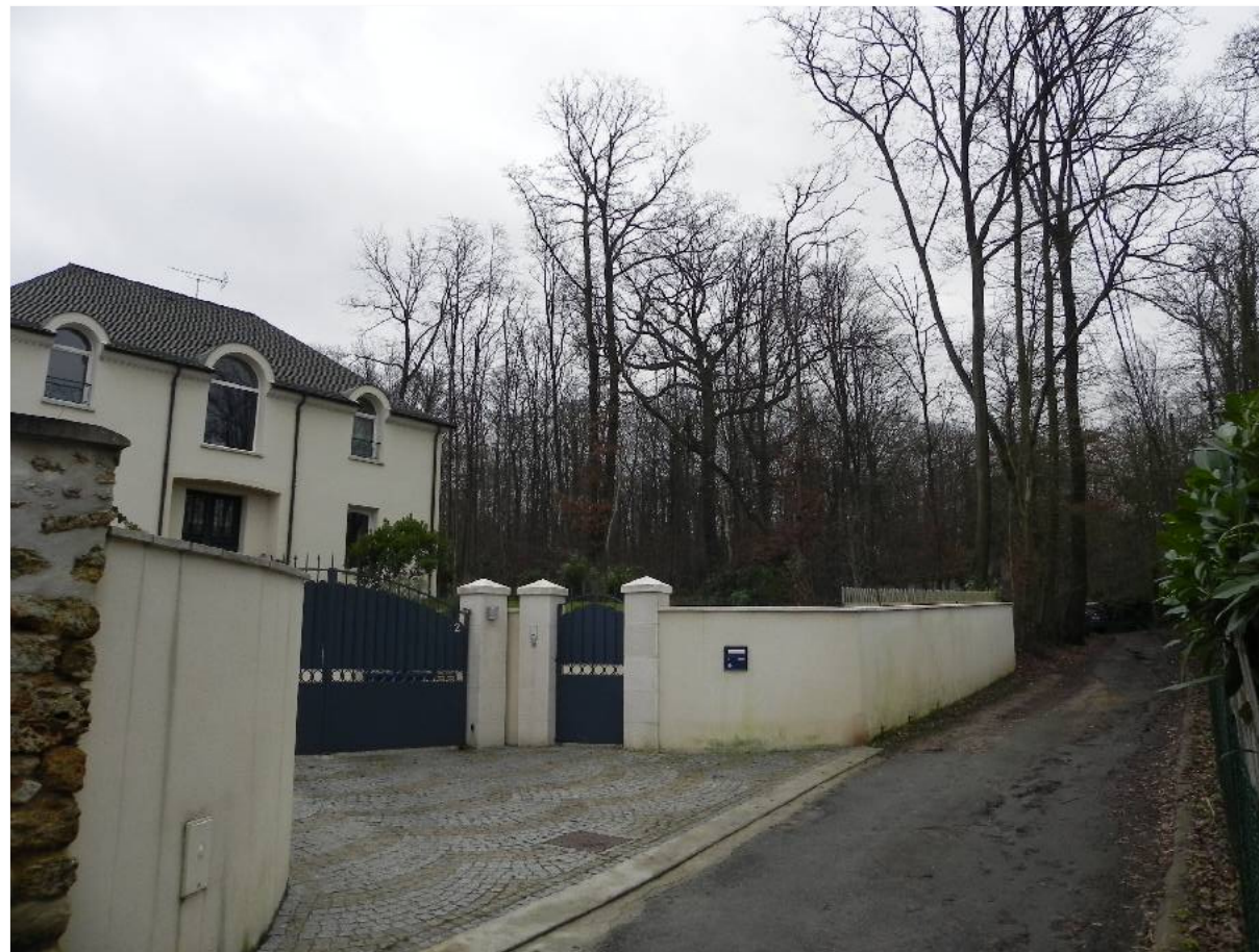
PHOTO 3 de loin - PCMI 08 -