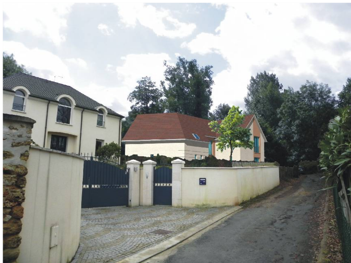
DOCUMENT GRAPHIQUE - PCMI 06 -