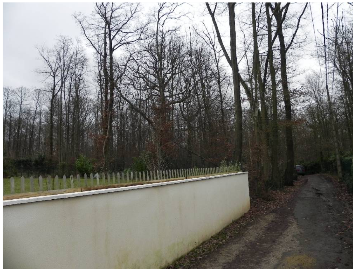
PHOTO 1 de près - PCMI 07 -