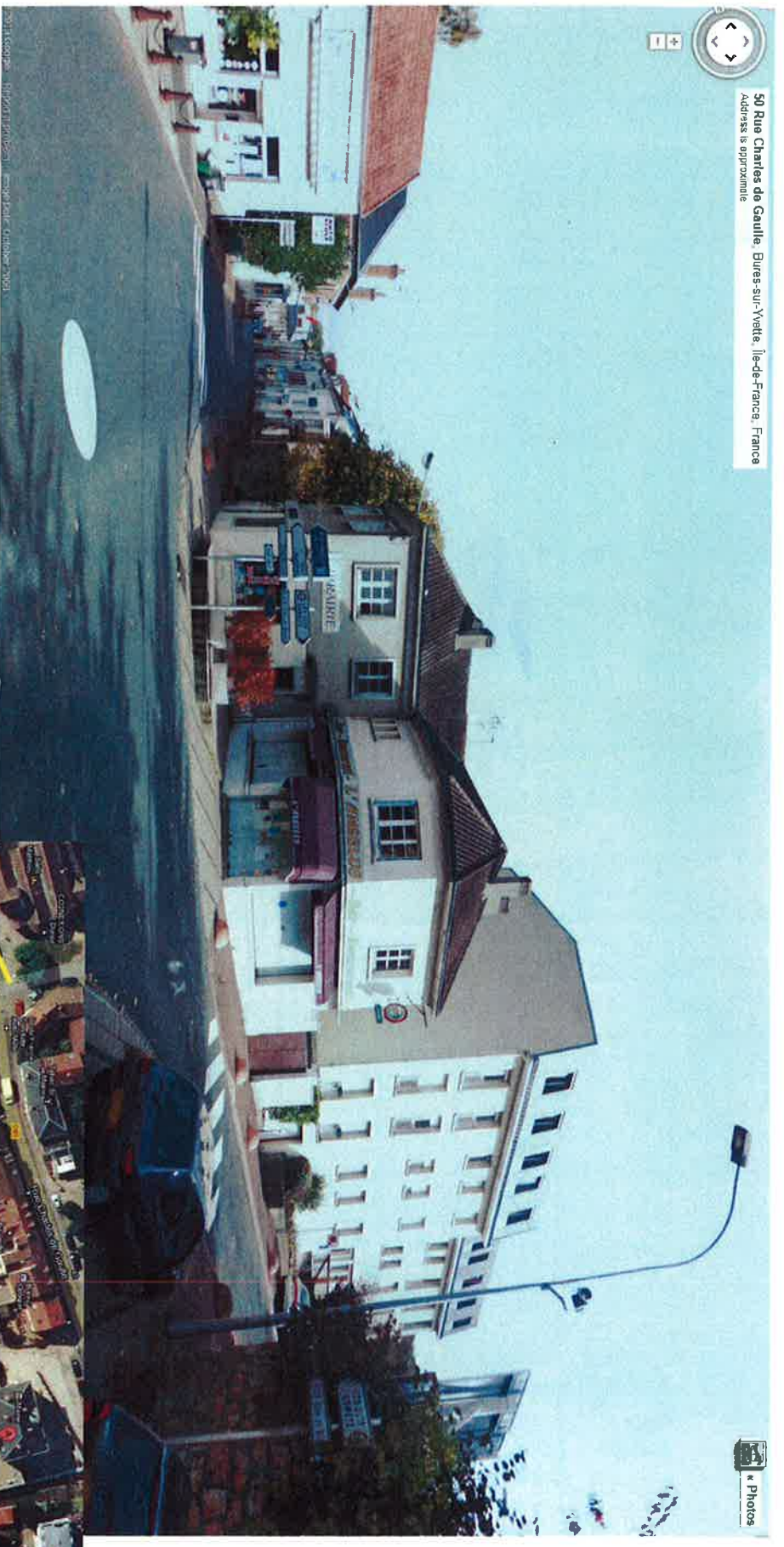
Partie du projet au Nord de la voie ferrée Paysage lointain 2