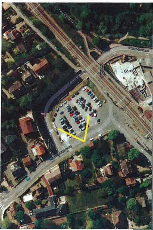
Partie du projet au Sud de la voie ferrée Environnement proche