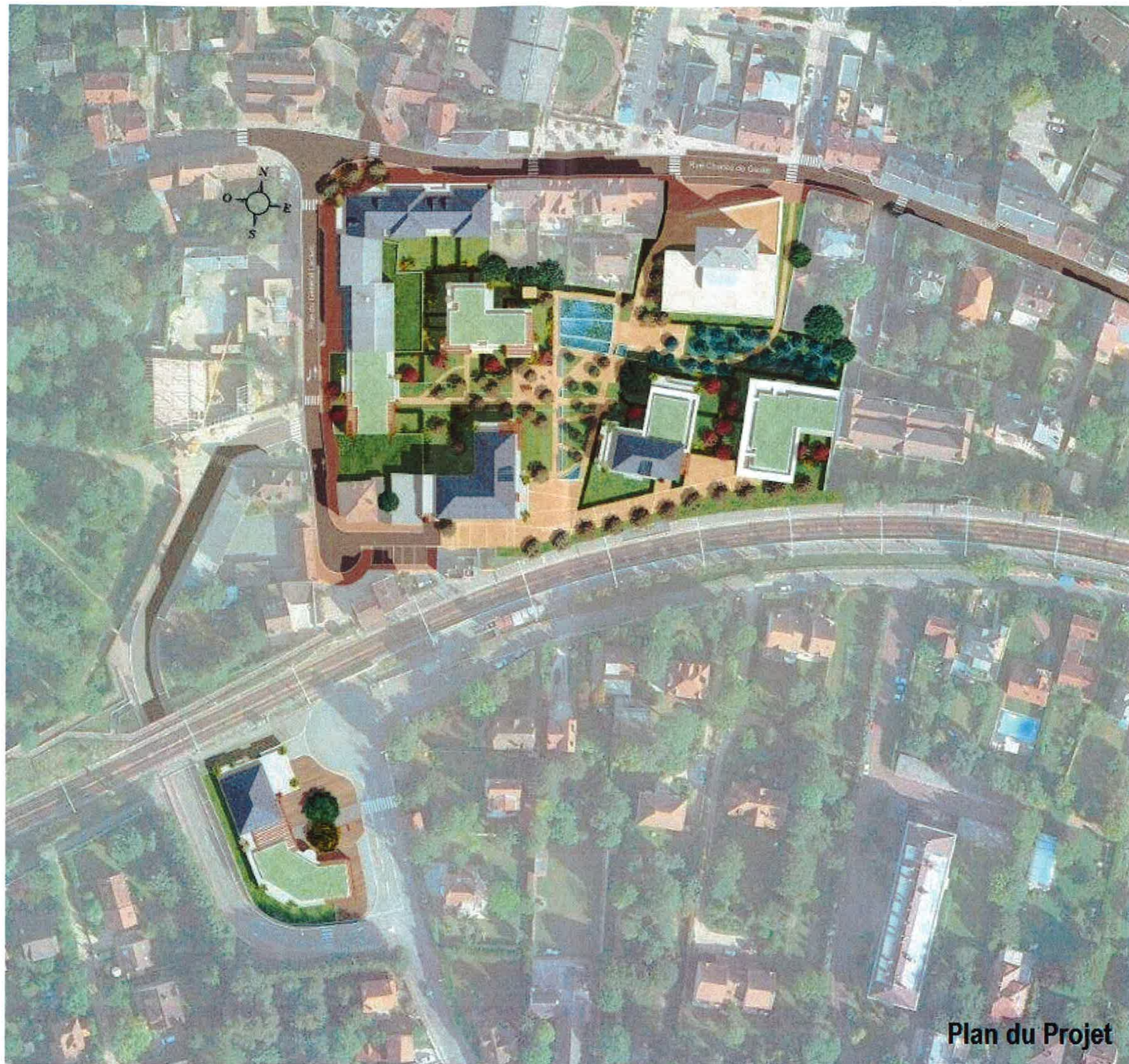
Plan du Projet