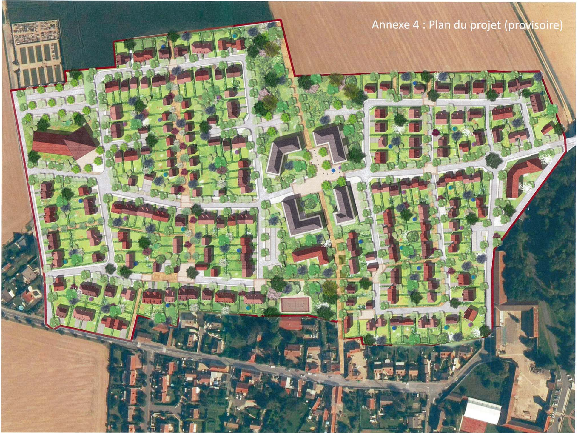
Annexe 4 : Plan du projet (provisoire)