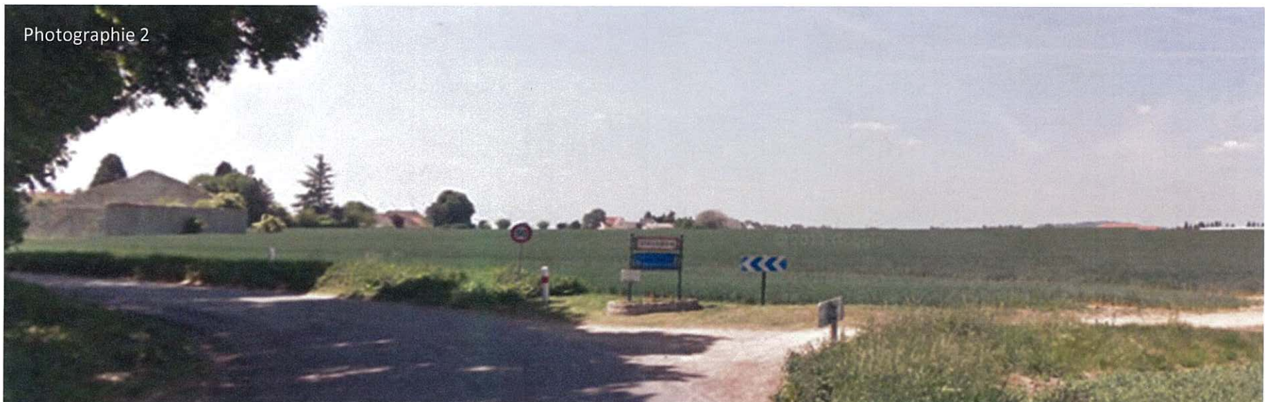
Photographie mai 2011