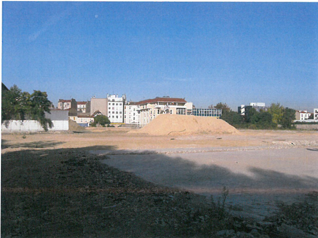
La réserve foncière