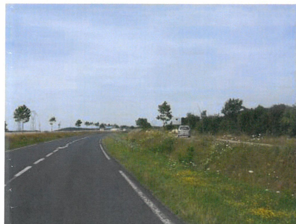
4) Route Départementale 191 vers Mennecey