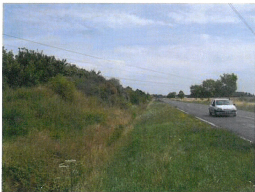
3) Route Départementale 191 vue vers Ballancourt