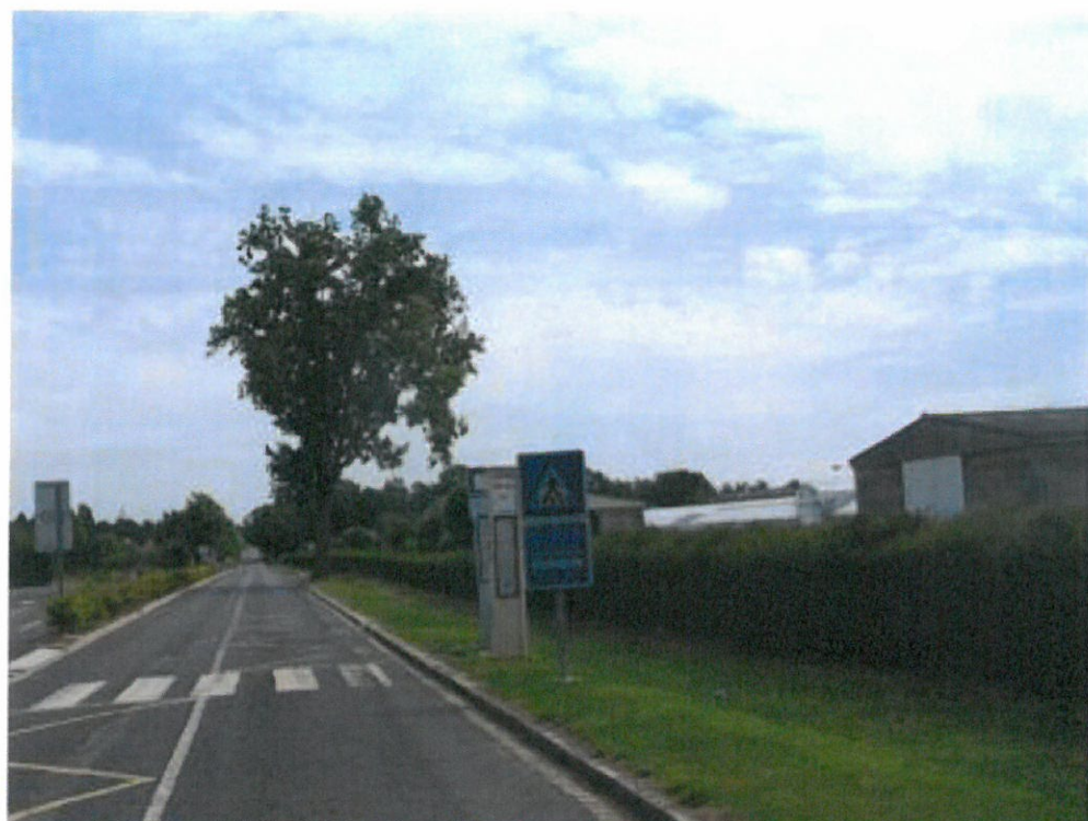
1) Avenue Saint Rémy – au droit de la rue du Château