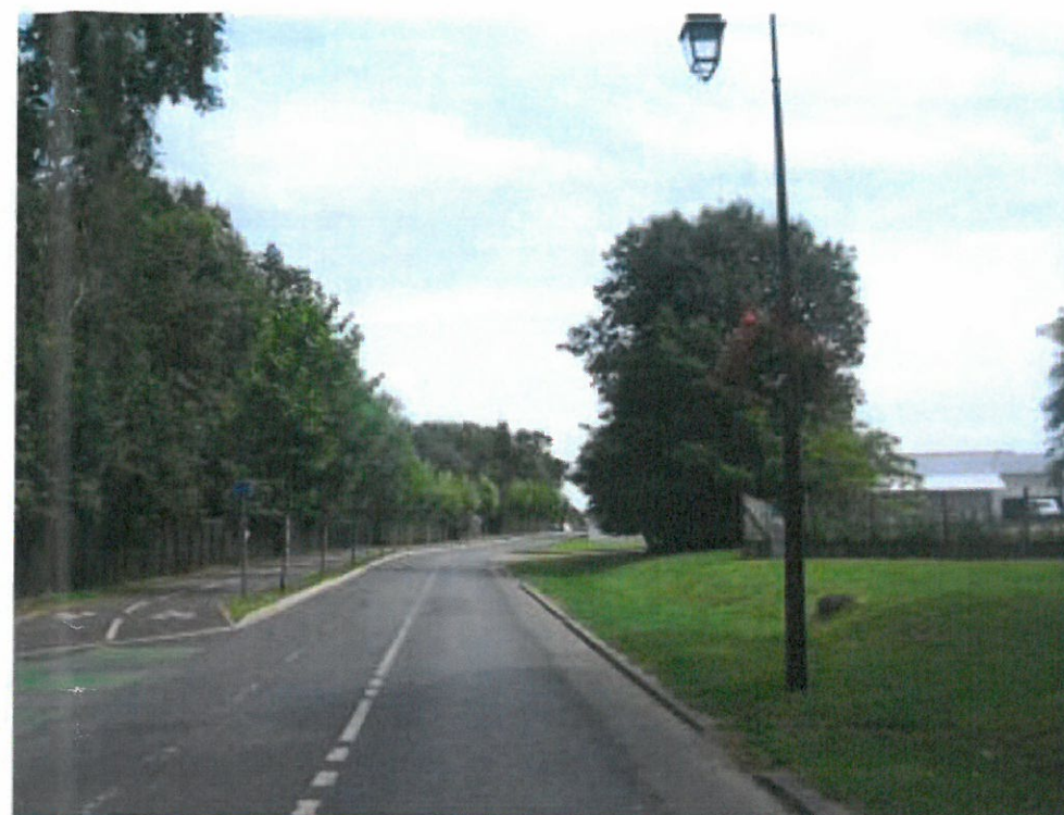
2) Avenue Saint Rémy au droit de l'exploitation agricole