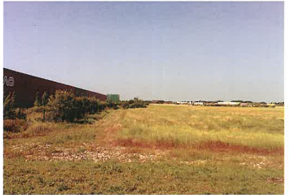
View n° 2