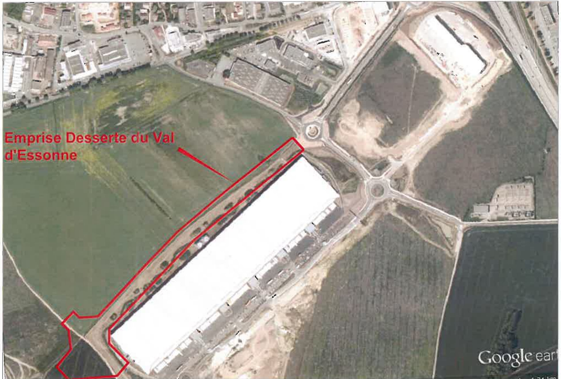
PHOTO AERIENNE DU FUTURE SITE