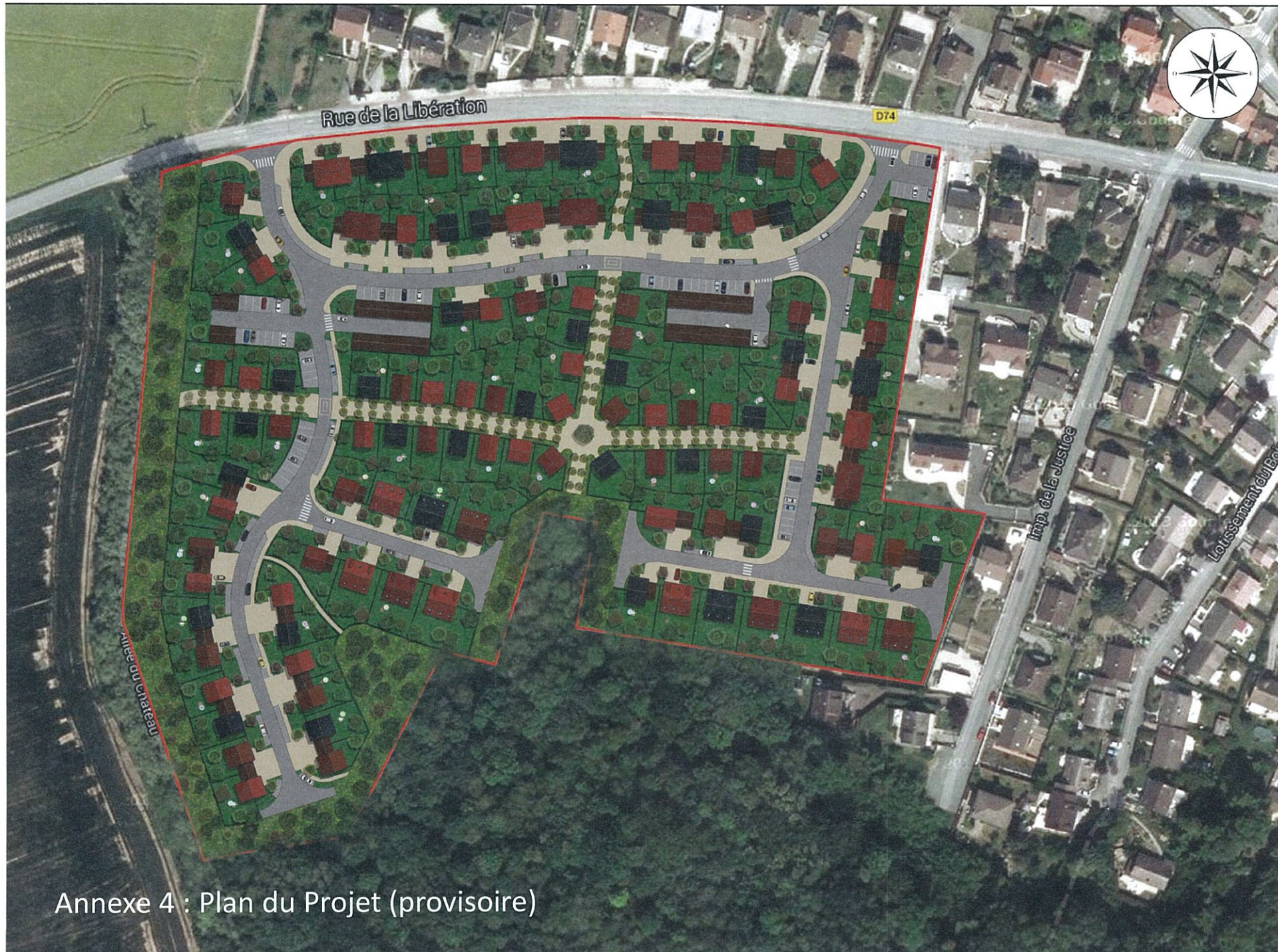
Annexe 4 : Plan du Projet (provisoire)