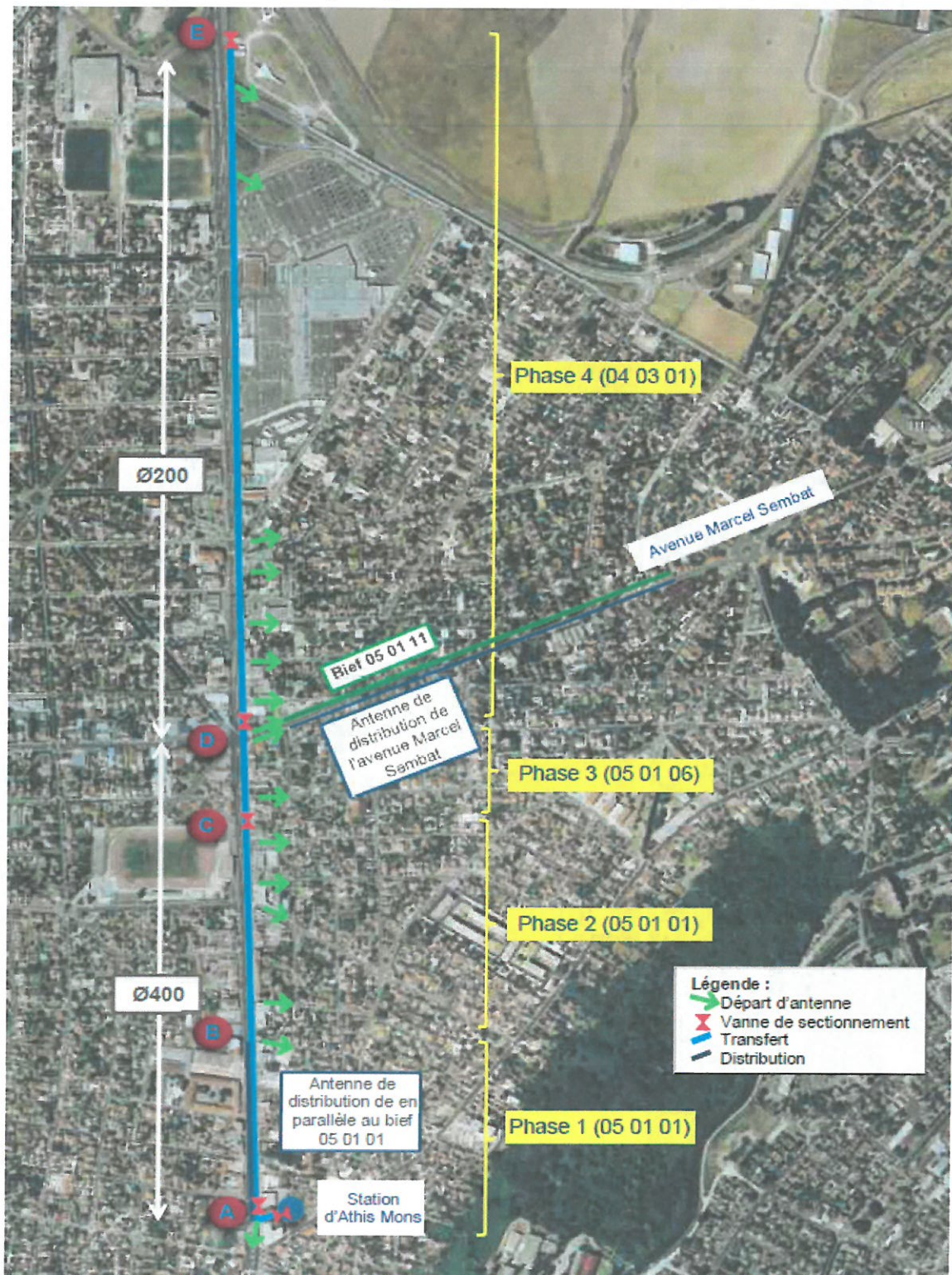
Figure 16 : Plan de phasage des travaux de l'Avenue François Mitterrand.