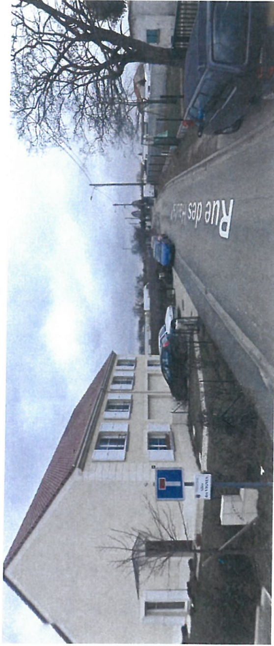
BALLAINVILLIERS Rue des Hauts Fresnais Février 2009 Photo 1