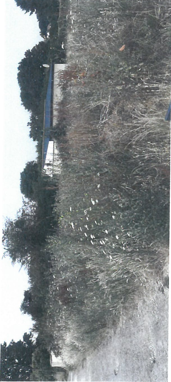
BALLAINVILLIERS Allée des Cétoines Juillet 2015 Photo 3