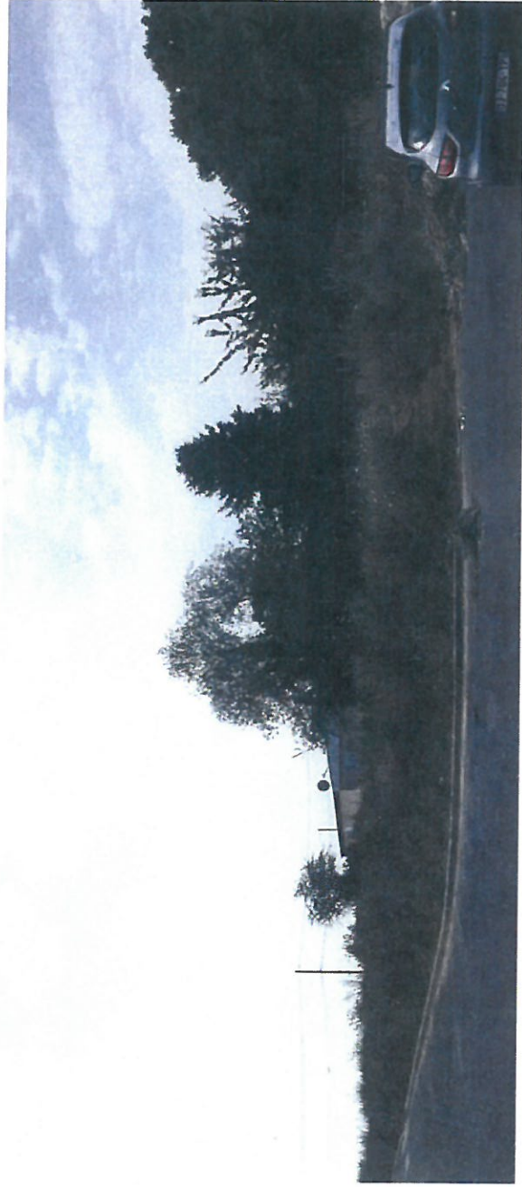
BALLAINVILLIERS Allée des Cétoines Juillet 2015 Photo 2