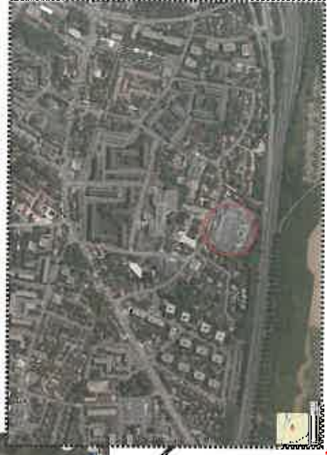
Localisation indicative du site