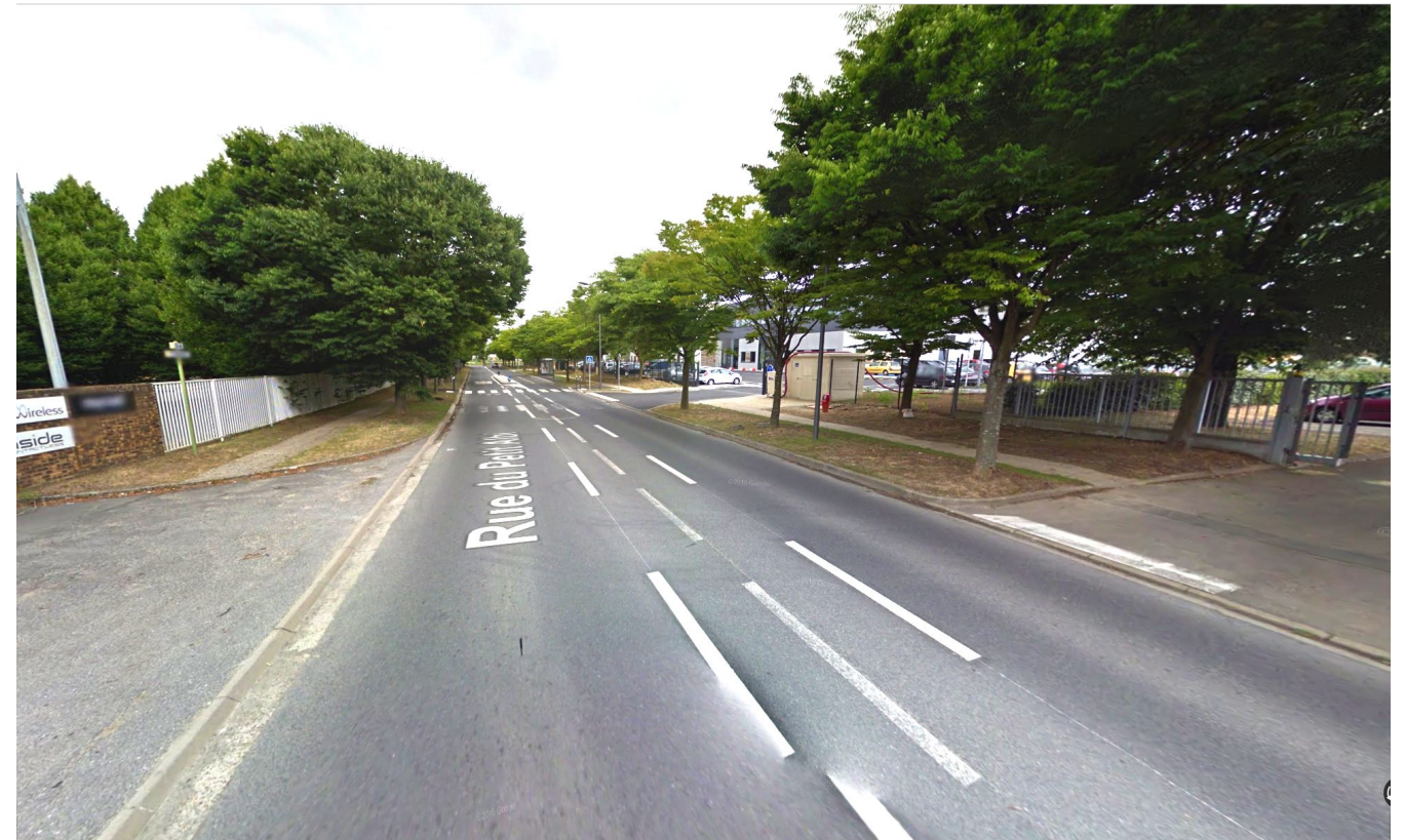
PC7 : PHOTOGRAPHIE ENVIRONNEMENT PROCHE