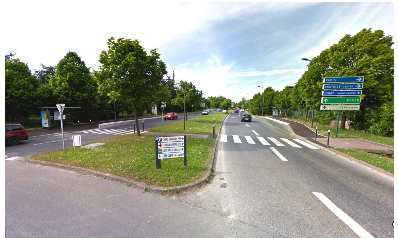
PC8 : PHOTOGRAPHIE ENVIRONNEMENT LOINTAIN