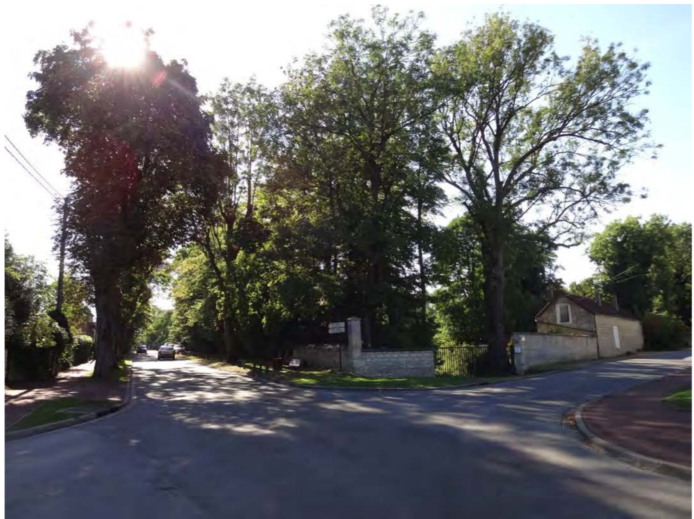
1_VUE DU CARREFOUR AVENUE DES BONSHOMMES ET RUE DE LA MADELEINE _ septembre 2015