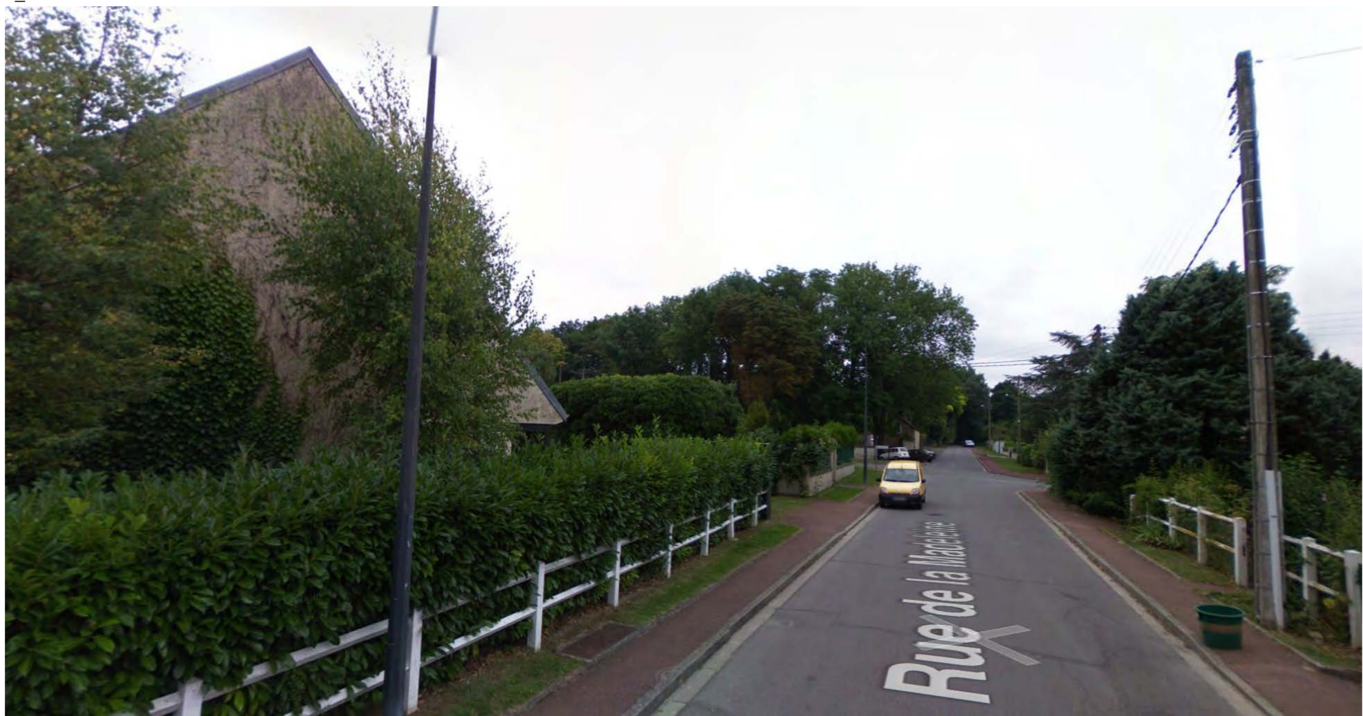
2_VUE DU CARREFOUR AVENUE DES BONSHOMMES ET RUE DE LA MADELEINE DEPUIS RUE DE LA MADELEINE