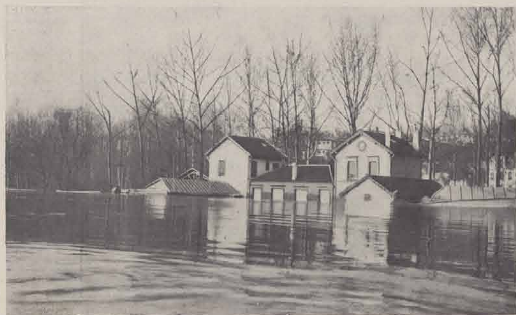
SAINT-MAURICE. — La Baignade.