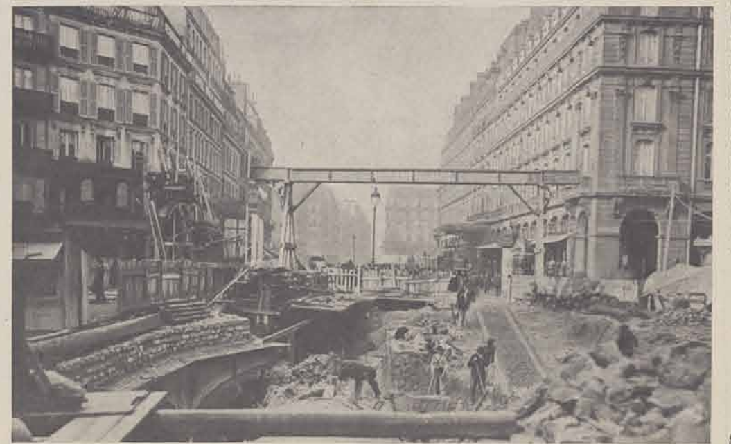
La Place du Havre le 1 er mars.

A. TARIDE, Éditeur, 18-20, Boulevard Saint-Denis, PARIS.