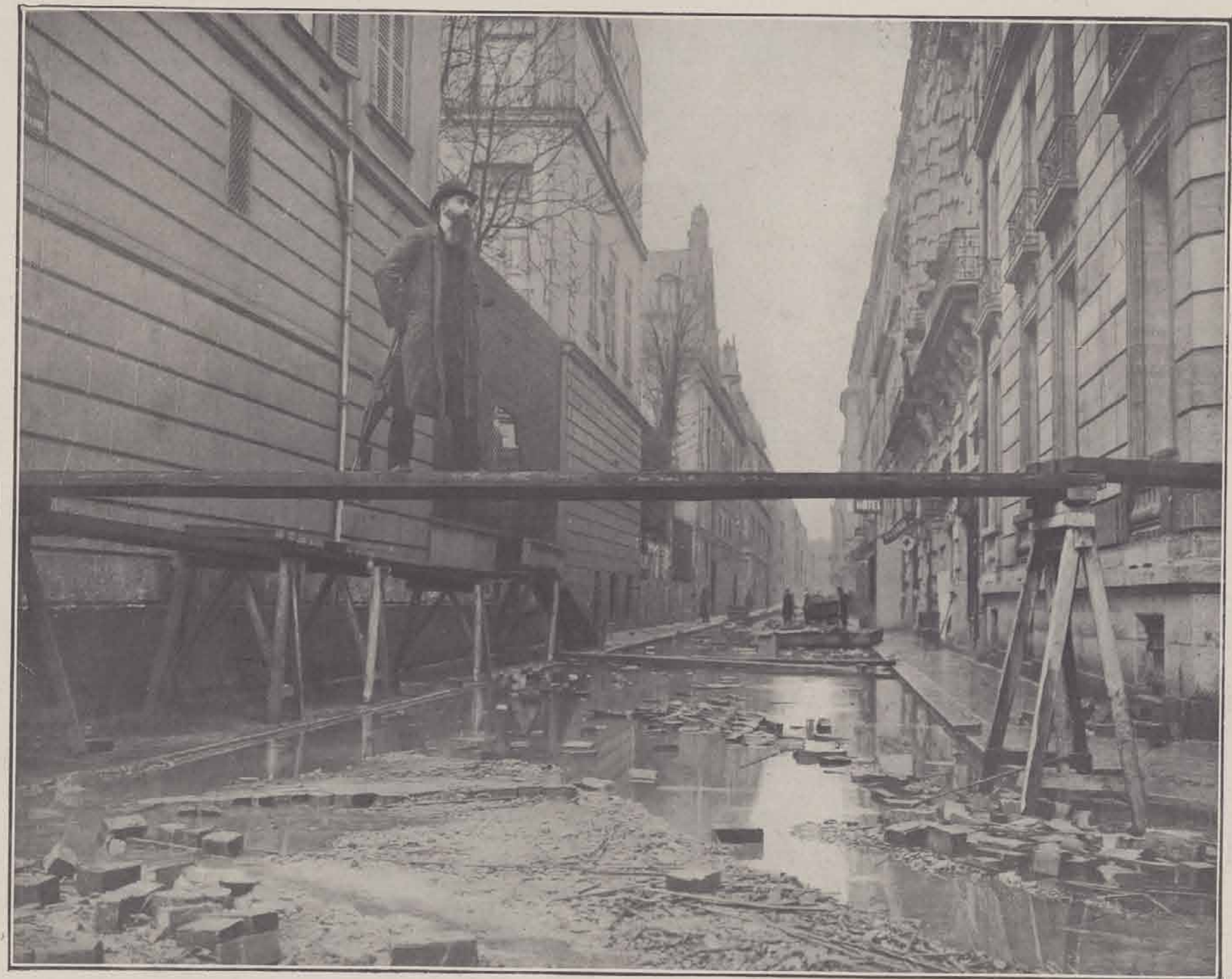
RUE DE BELLECHASSE APRES L'INONDATION