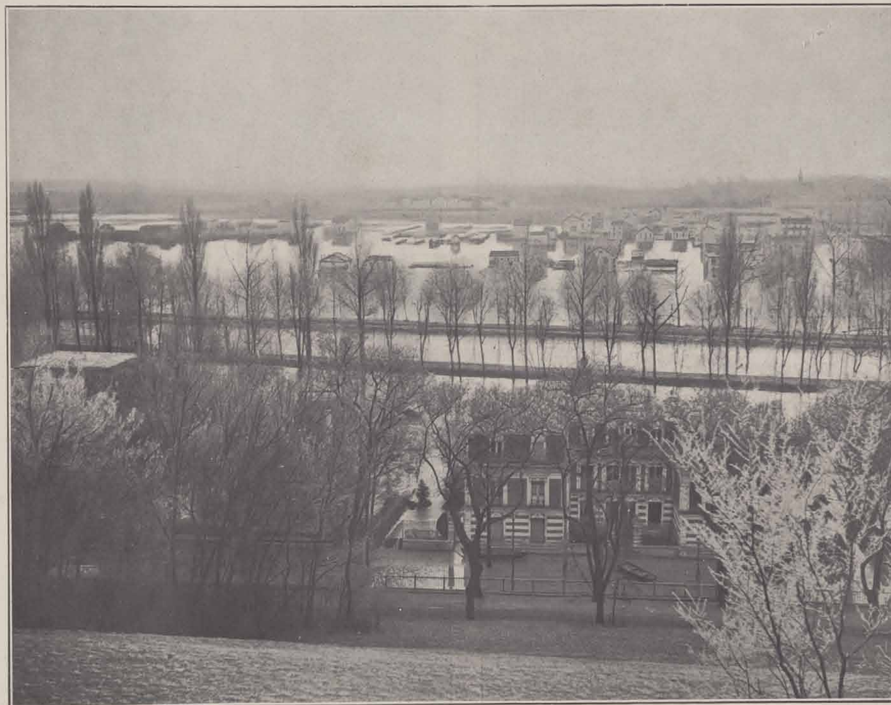
VUE GÉNÉRALE PRISE DU PLATEAU DE GRAVELLE