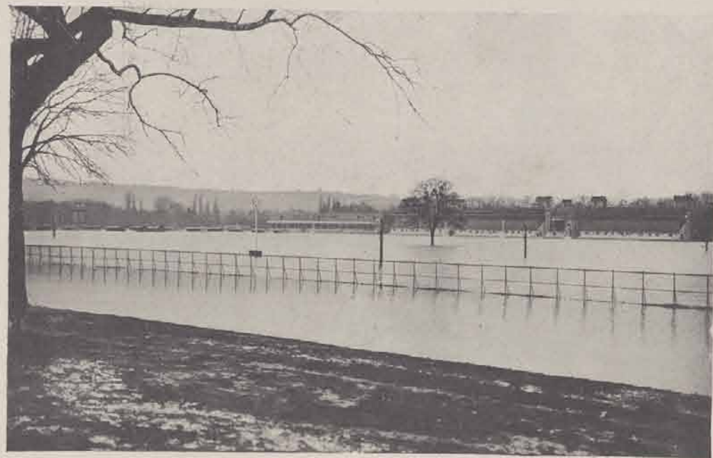
Hippodrome de Longchamps.