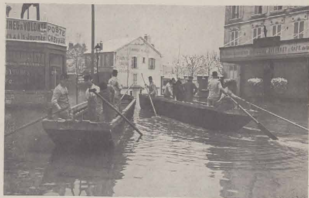
RUEIL. — Les canots de sauvetage.