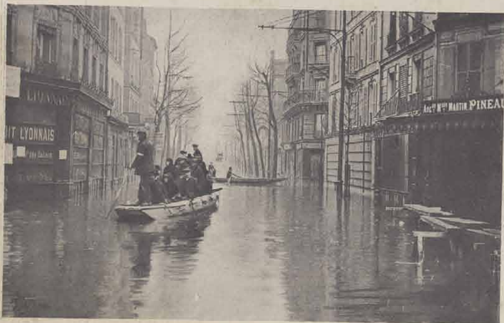
ASNIÈRES. — Grande-Rue.