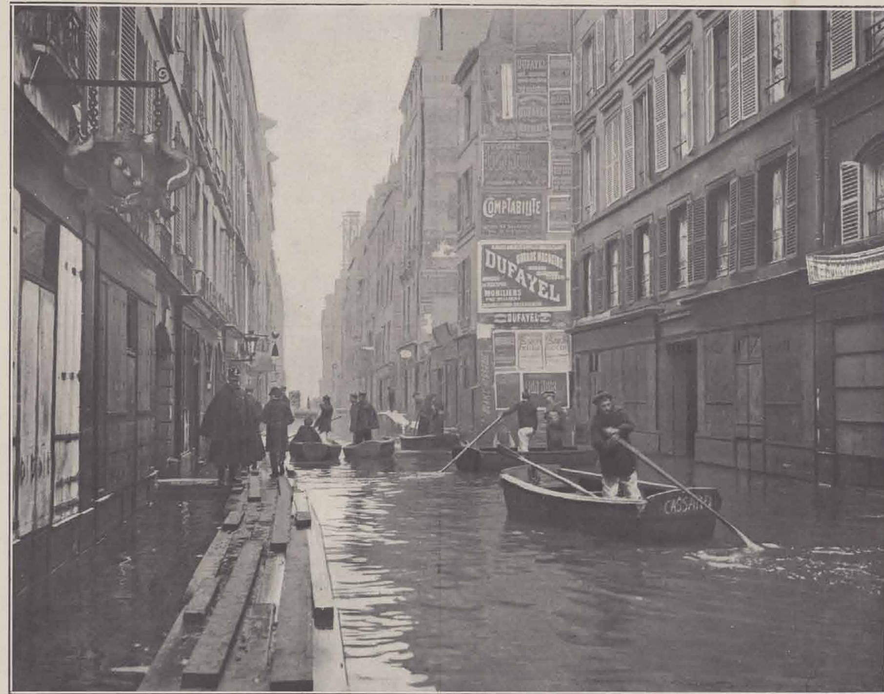
RUE DE L'UNIVERSITÉ