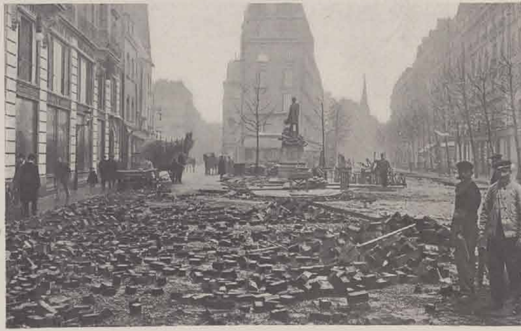
Rue Traversière et avenue Ledru-Rollin : Ce qui reste de la chaussée.