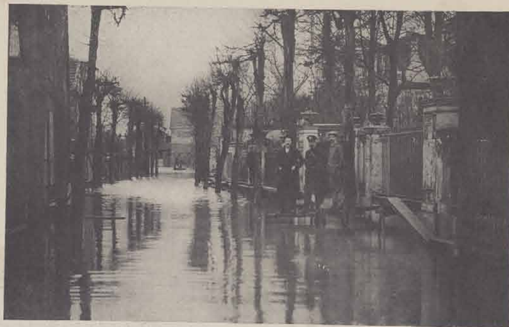
ILE DE SAINT-DENIS. — Rue du Bocage.