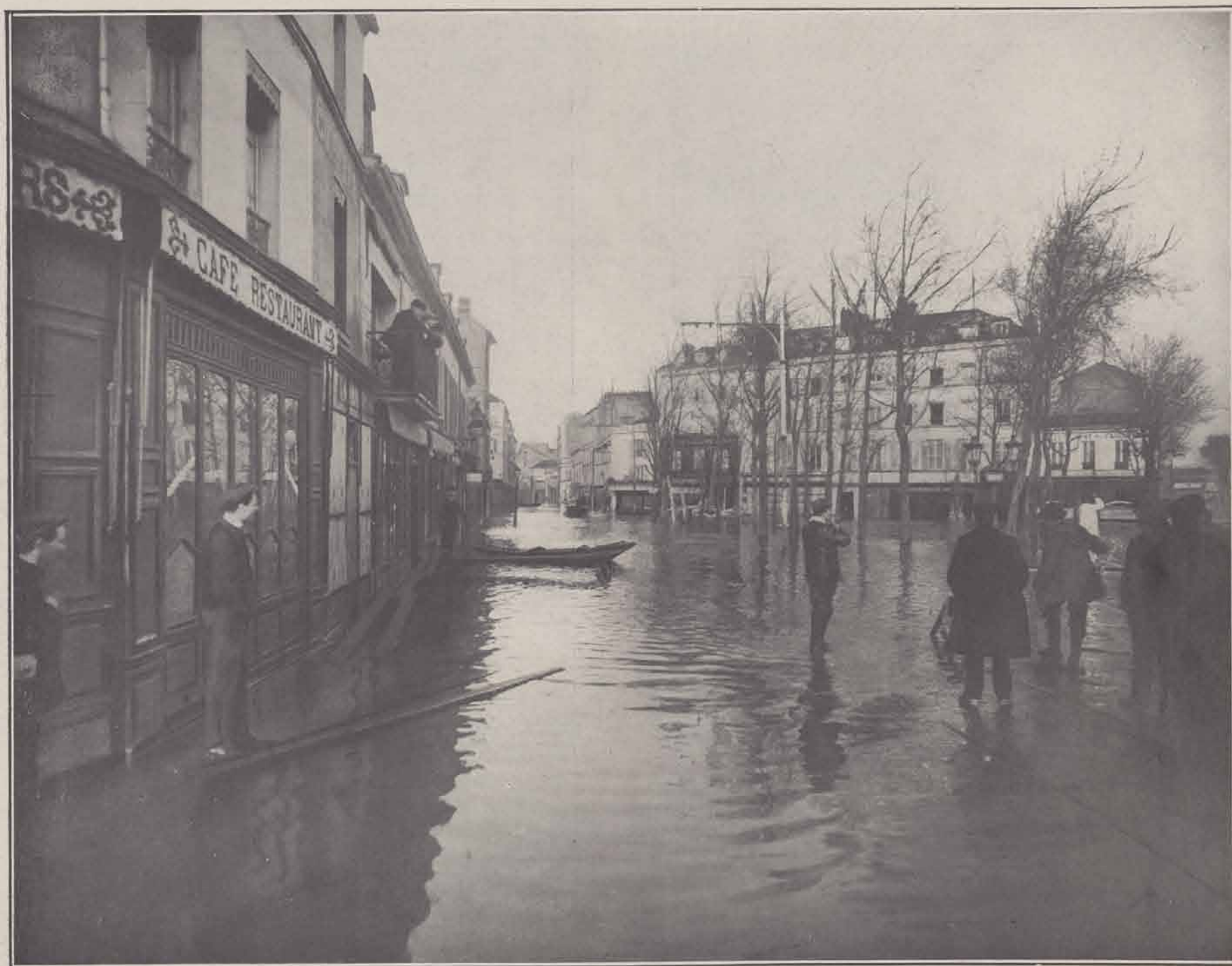
COURBEVOIE (place du Port et rue de Paris).