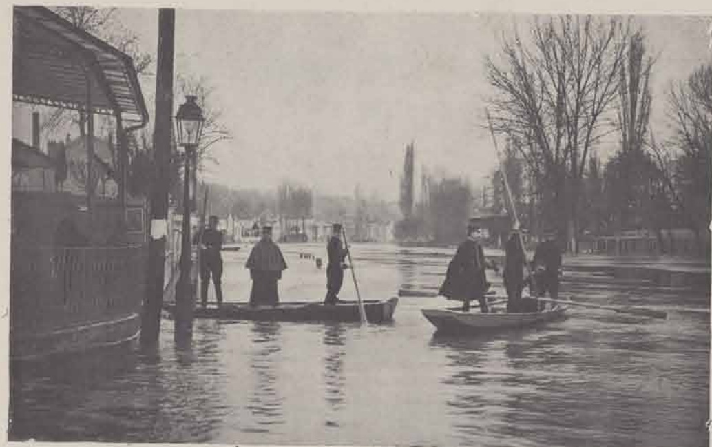
JOINVILLE. — La Marne en amont.