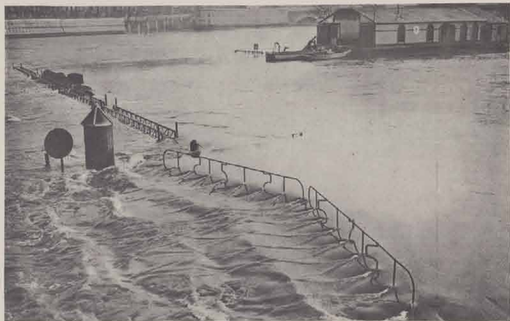
Ecluse de la Monnaie.