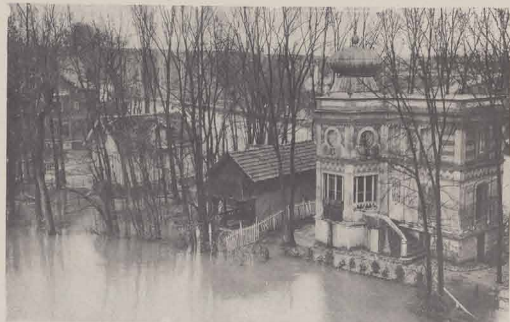
NOGENT-SUR-MARNE. — L'Île des Loups.