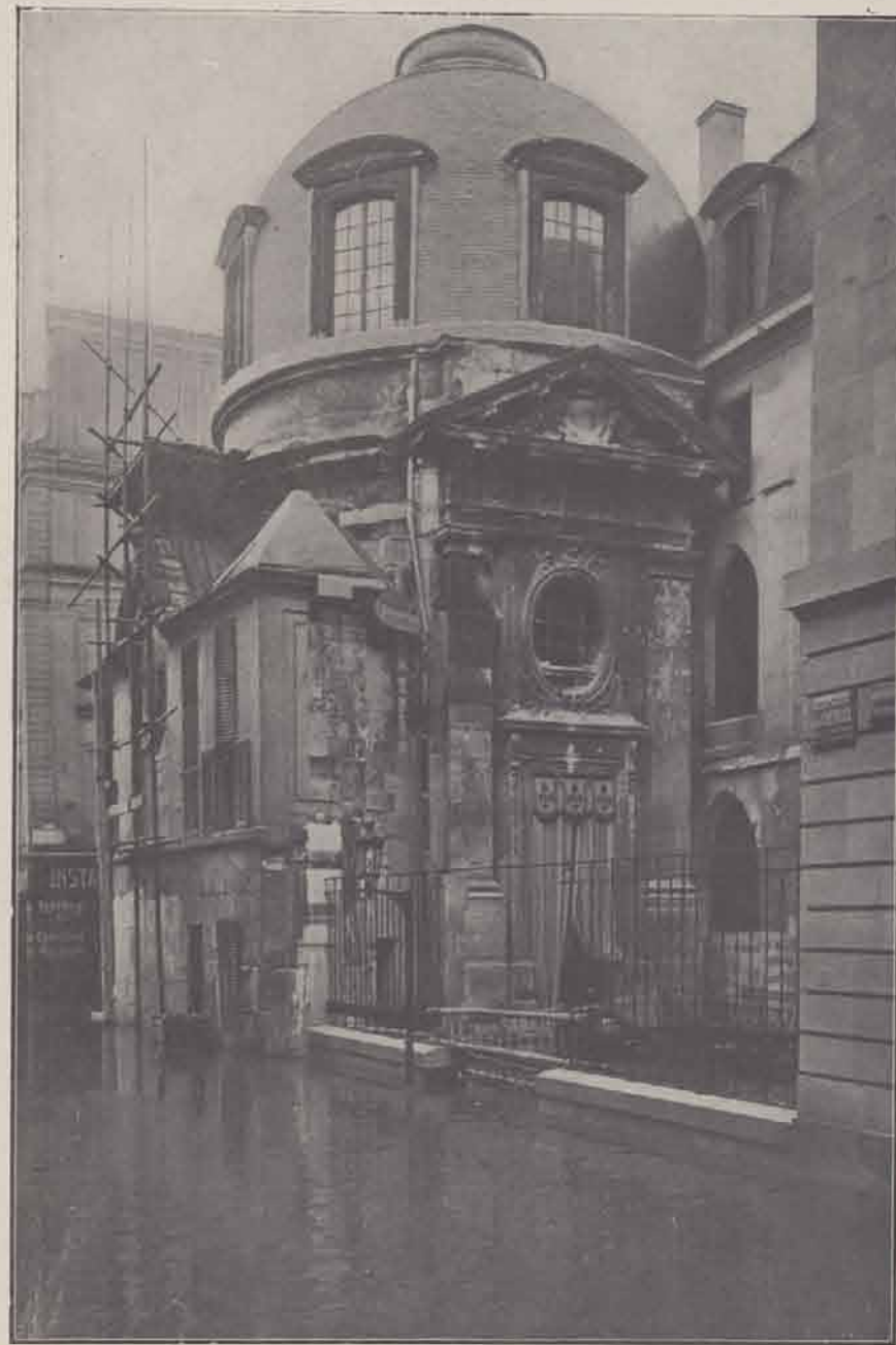
Rue de la Bûcherie : Maison des Etudiants.