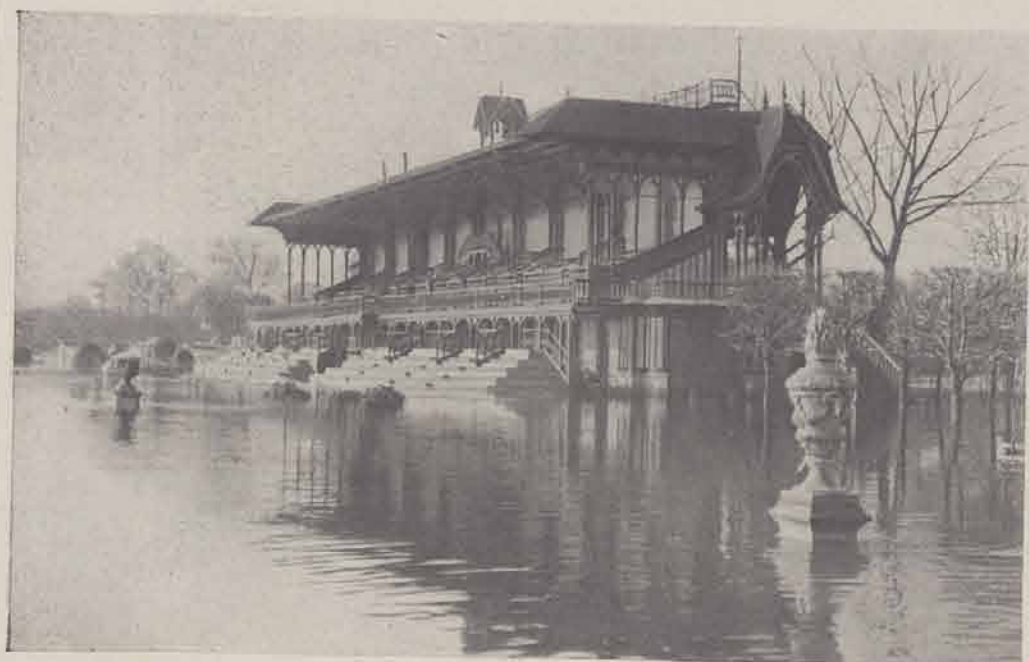
MAISONS-LAFFITTE. — Les Tribunes du champ de courses.