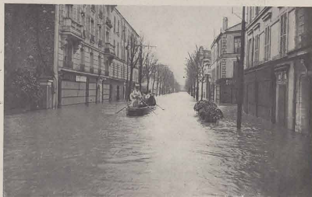
IVRY. — Rue Nationale.