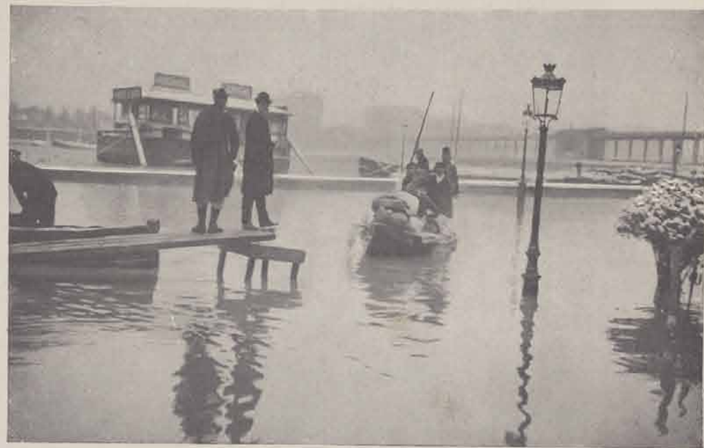
Passy : Déménagement.