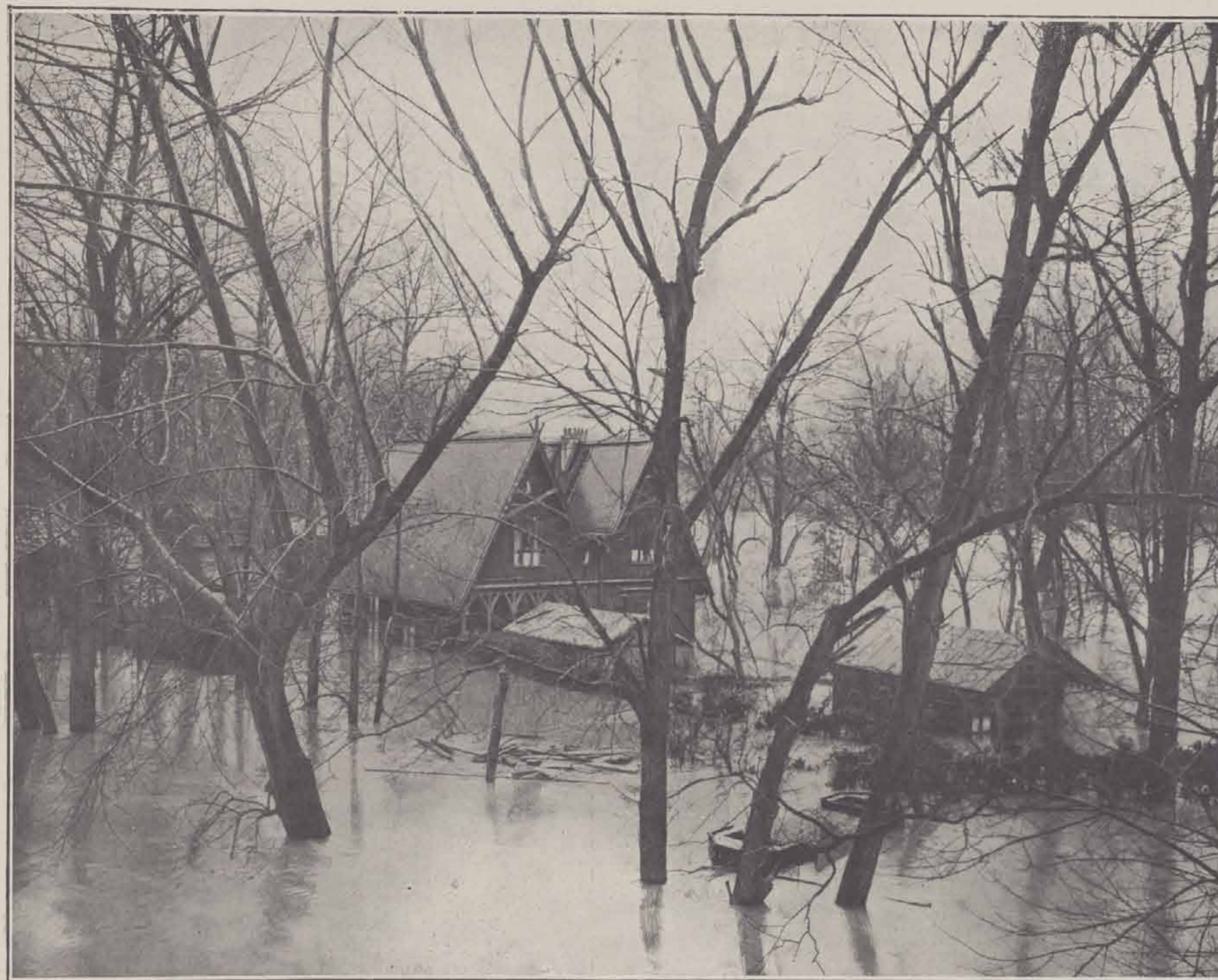
ILE DE PUTEAUX — TENNIS-CLUB