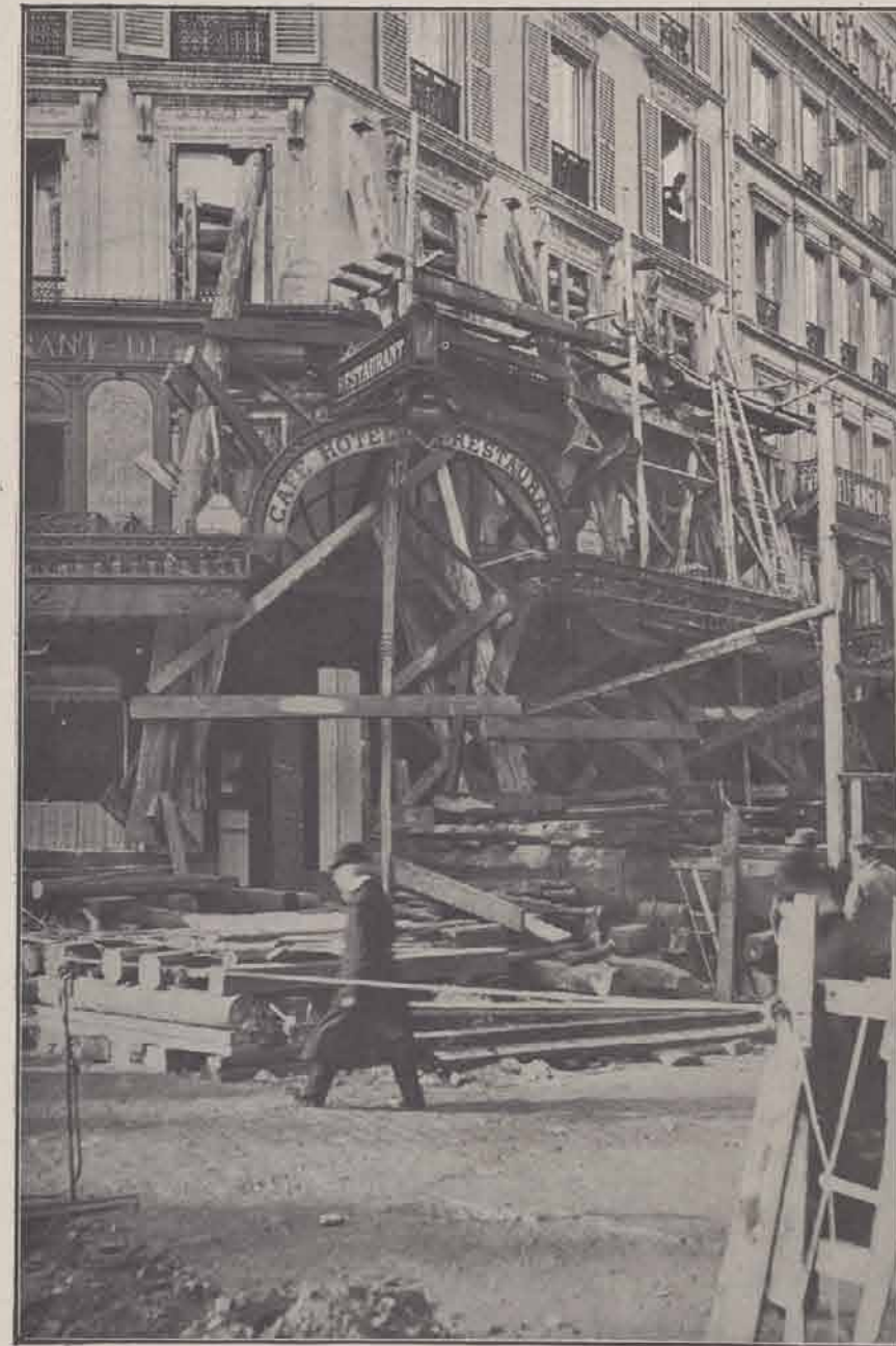
Rue Saint-Lazare : Maison minée par les eaux.