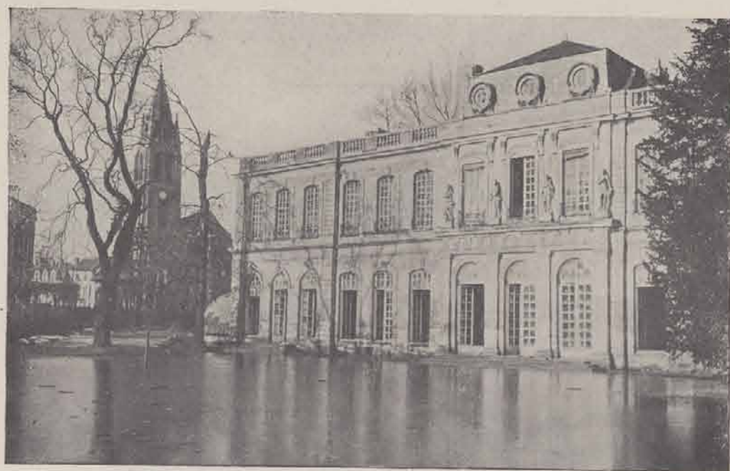
VITRY. — Le Château et l'Eglise.