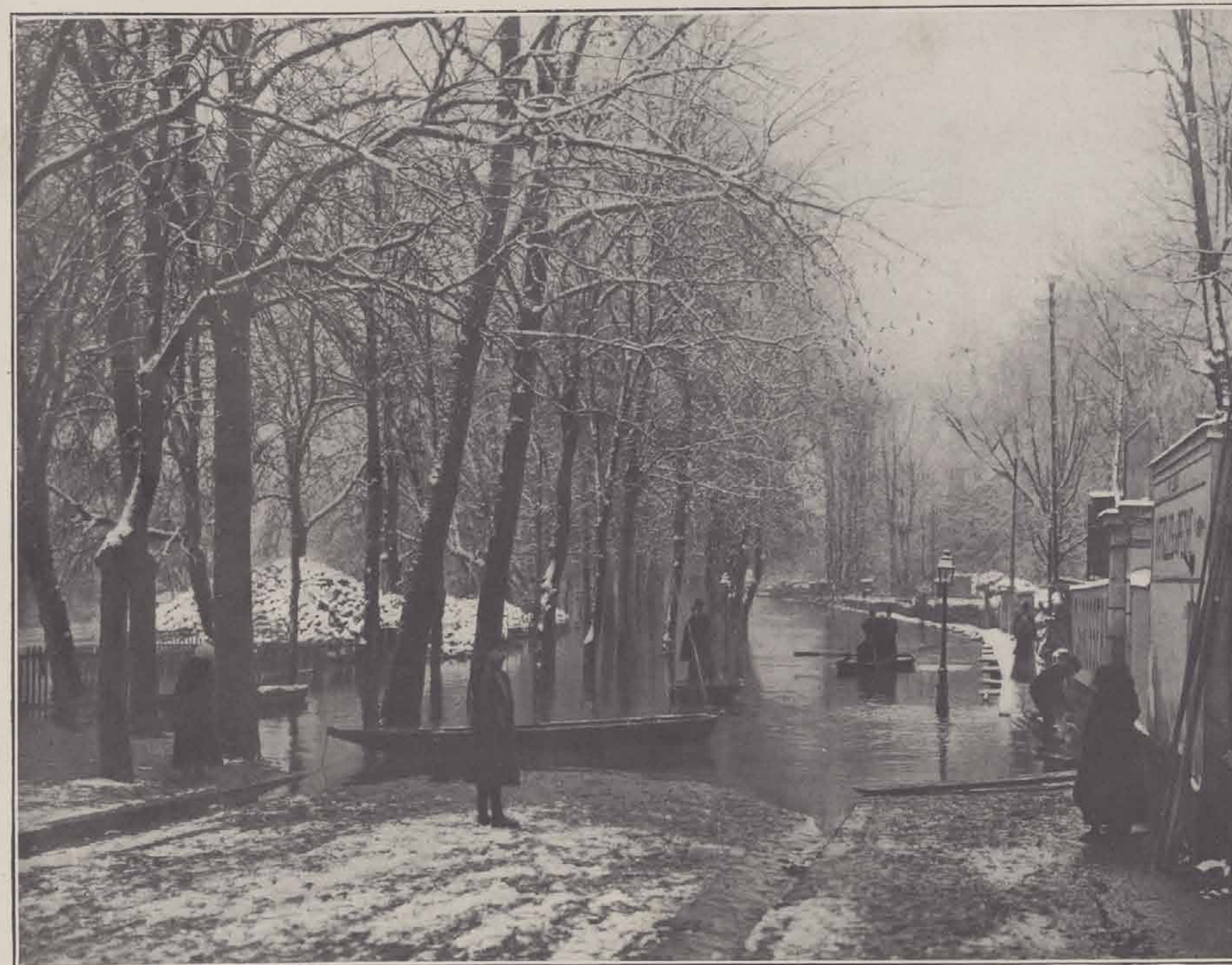
NEUILLY. — ÎLE DE LA GRANDE-JATTE