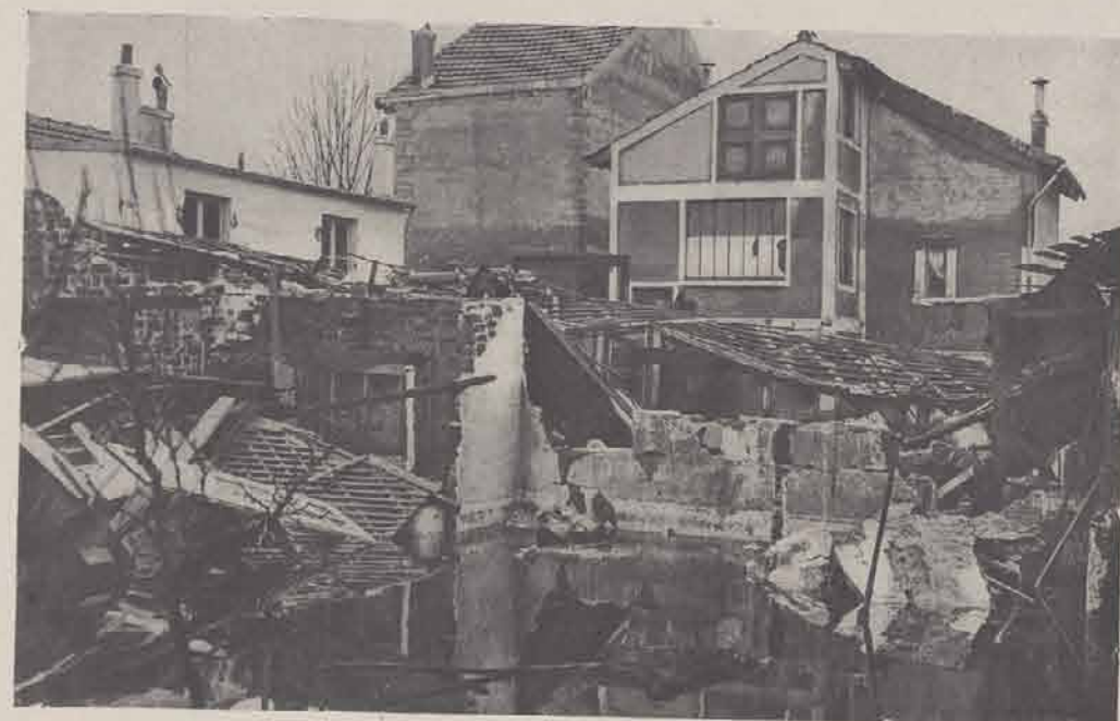
ALFORTVILLE après l'inondation.