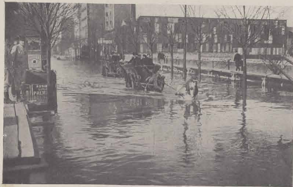
Rue de la Convention.