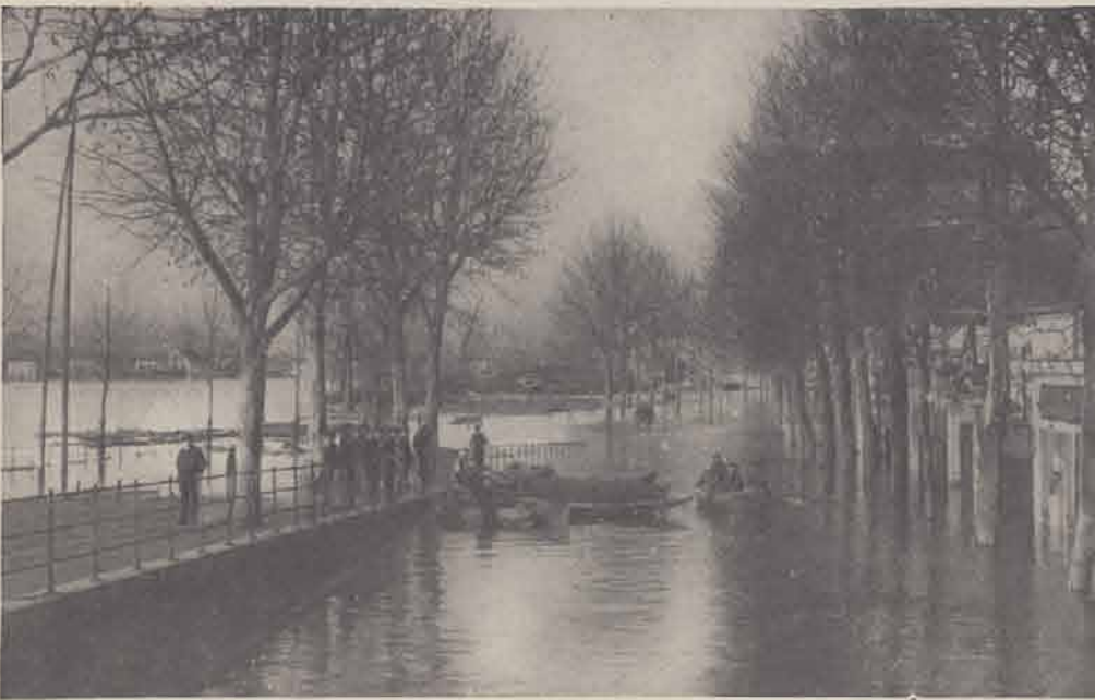
CHARENTON. — Quai de Bercy.