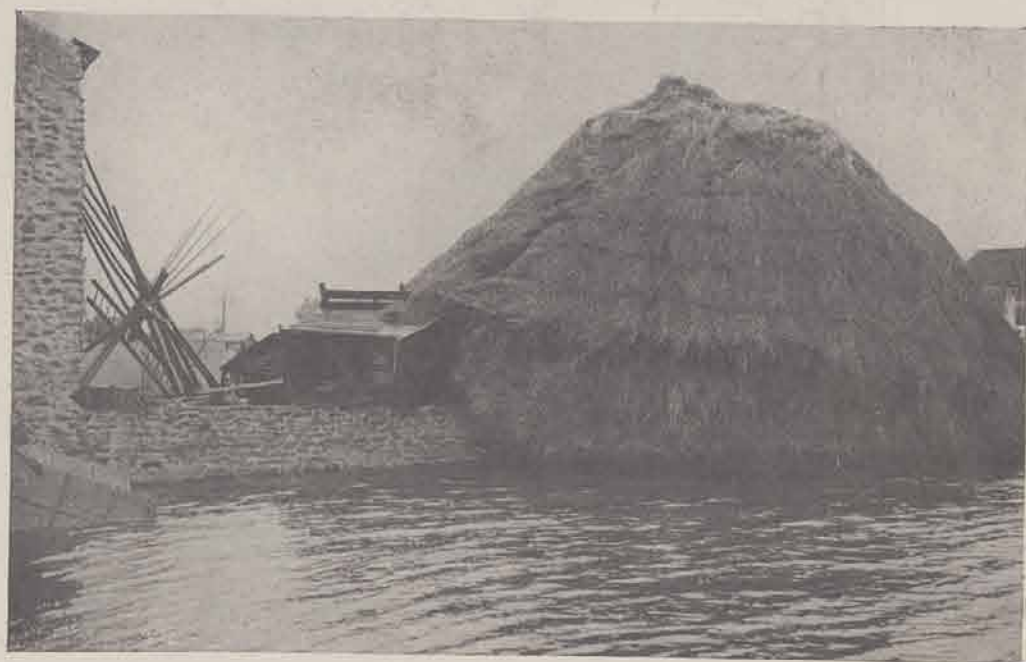
ALFORTVILLE. — Meule de paille échouée sur un mur.