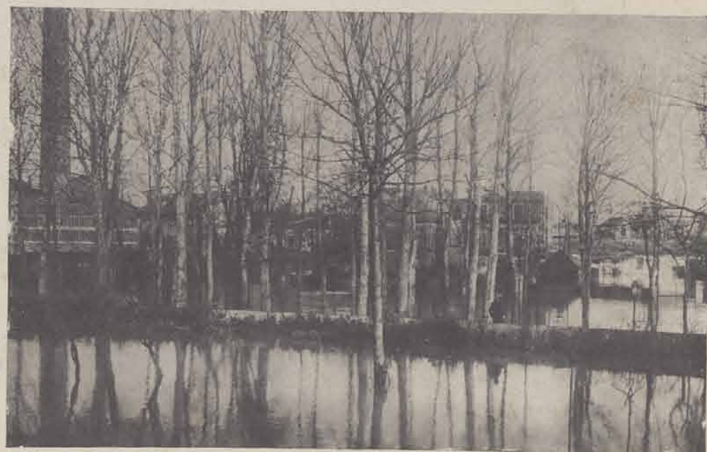
NEUILLY. — Boulevard Victor-Hugo