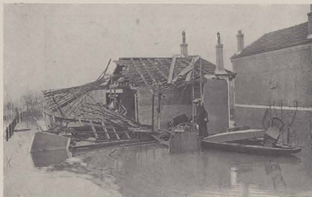
MAISONS-ALFORT. — Retour au logis.