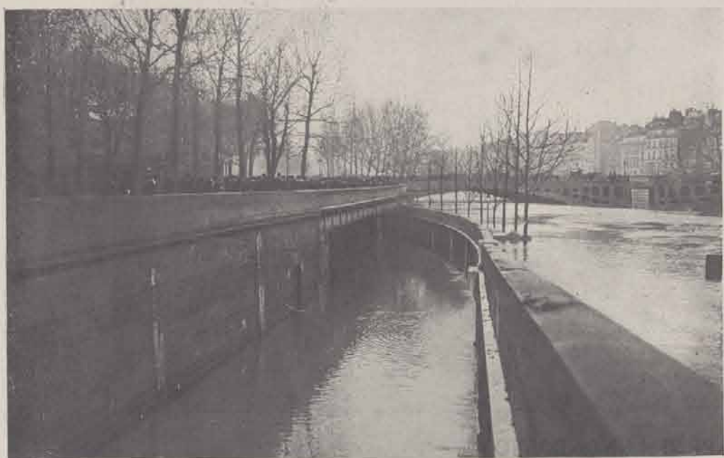
Le chemin de fer d'Orléans au quai Saint-Bernard.