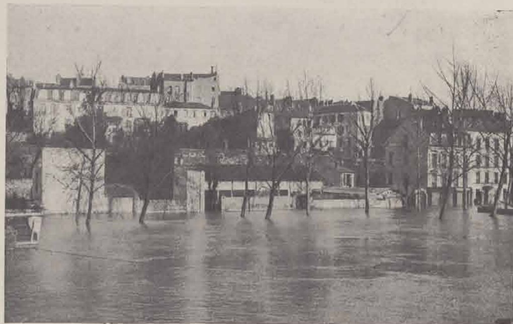
CHARENTON. — Quai de Charenton.