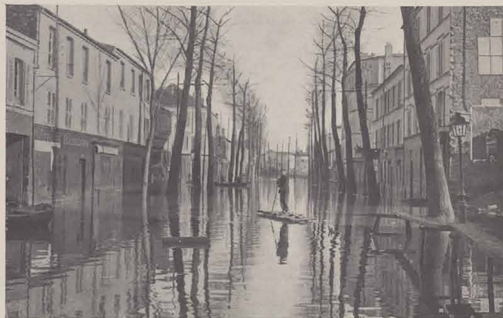
IVRY. — Rue du Port-d'Ivry.