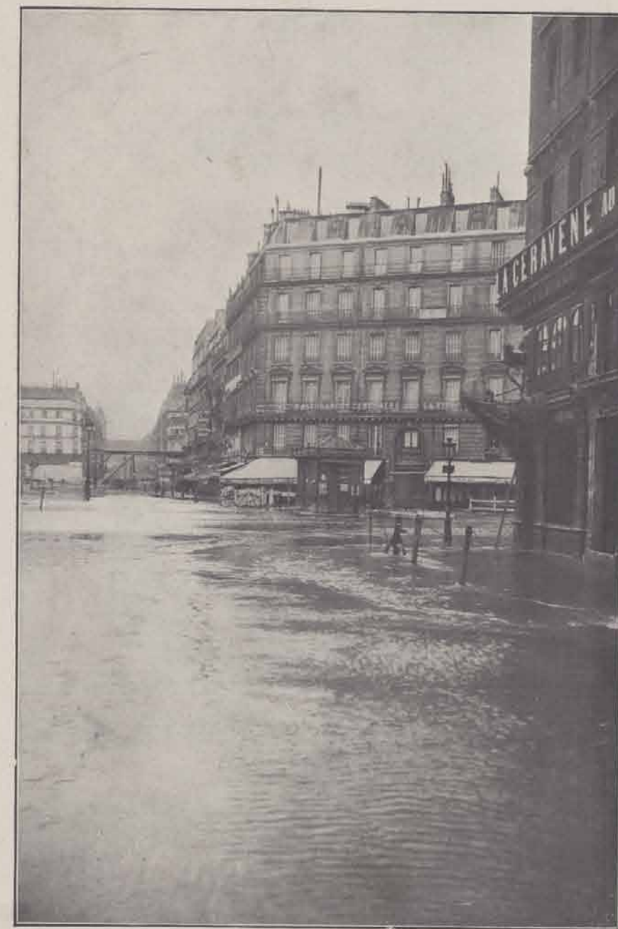
Rue de la Pépinière et rue Saint-Lazare.