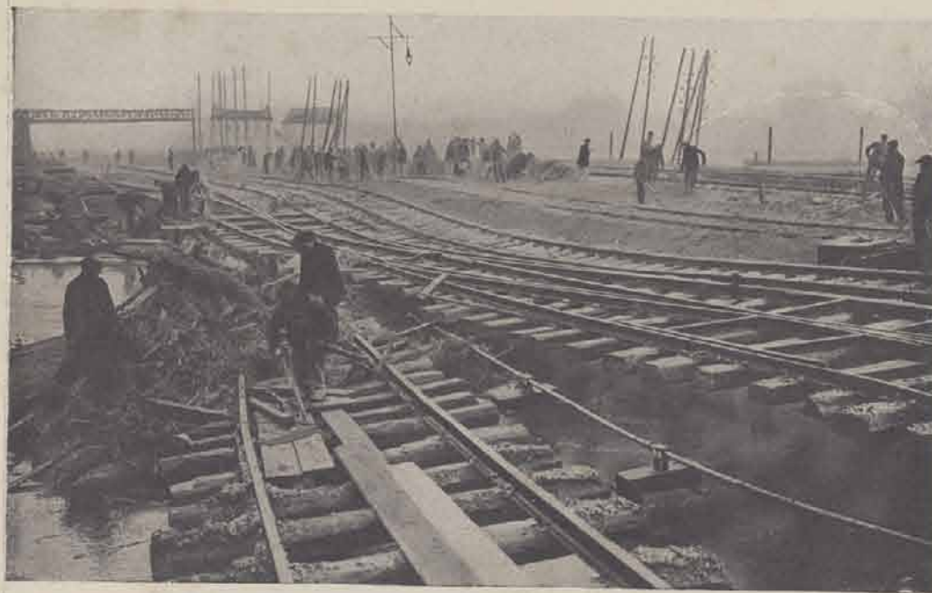
La ligne du P. L. M. entre Maisons-Alfort et Villeneuve-Saint-Georges.